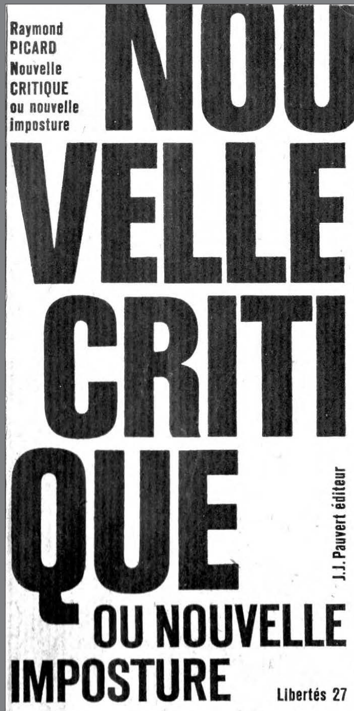
RAYMOND PICARD, Nouvelle Critique ou nouvelle imposture ?, 1965.