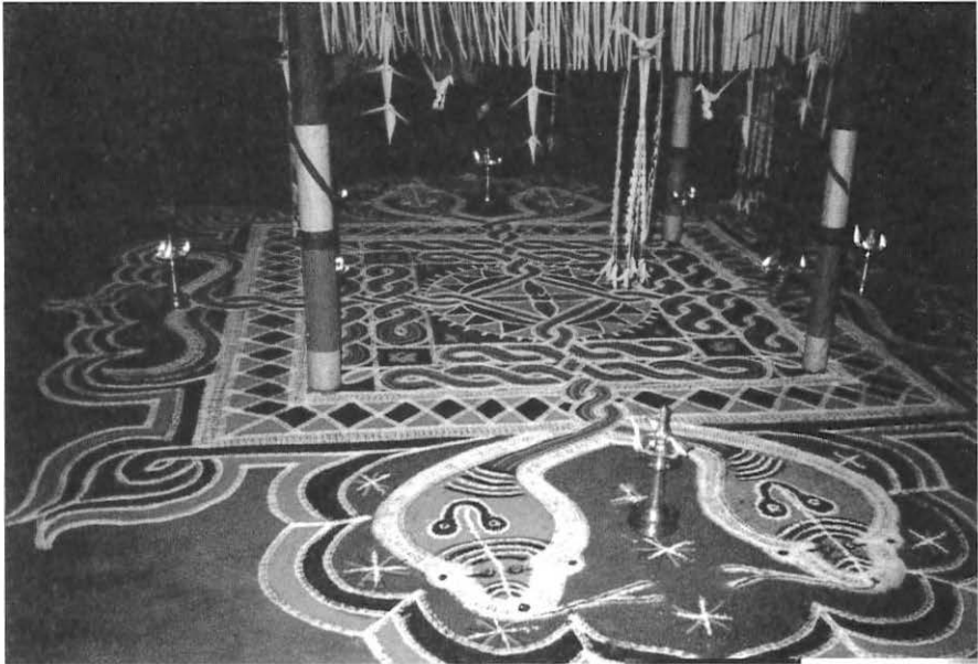
Dessin de sol ( kalam ) dans un culte aux divinités serpents Trichur Dt. Photo : Chr. Guillebaud, 2000

« Quand j'aurai fini cela, mon corps et mon visage se tourneront vers l'Est [direction où les divinités du dessin font face]. La vision des serpents sera dans le kalam . Deux oracles ( komaram ou piniyal ) s'y assieront ».