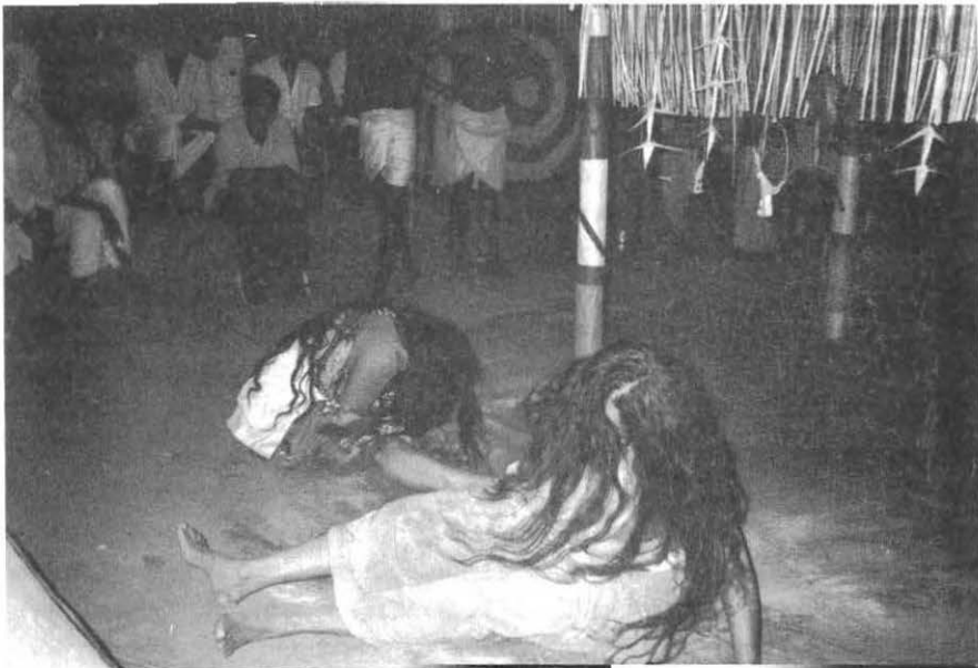
Possédées dans un culte aux divinités serpents Palakkad Dt. Photo: Chr. Guillebaud, 2000