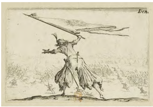
Le porte-étendard (série Les caprices ), Jacques Callot (1617)

2. La référence concernant l'histoire de l'émergence de ce modèle est évidemment Chandler (1977). Pour une présentation exhaustive du modèle du point de vue comptable, on pourra notamment consulter les portraits de Sloan et Brown proposés par Bouquin (2005) ou reprendre l'ouvrage classique de Johnson & Kaplan (1987).