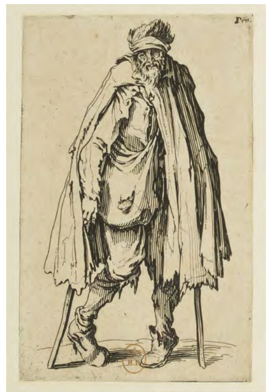
Le mendiant aux béquilles et à la besace (série Les gueux), Jacques Callot (1622-1623)