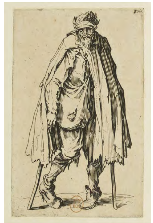
Le mendiant aux béquilles et à la besace (série Les gueux), Jacques Callot (1622-1623)