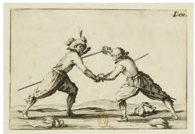
Le duel à l'épée, (série Les caprices), Jacques Callot (1617) [source Gallica.bnf.fr / BnF]

3. La littérature en contrôle de gestion est largement fragmentée et même balkanisée en fonction des diverses approches théoriques – qui se combinent la plupart du temps avec des méthodes de recherche spécifiques (Euske et al. , 2011). Elle est aussi marginalisée puisque de moins en moins de place est accordée au contrôle de gestion dans les revues généralistes en comptabilité ; les publications dans ce domaine devant alors se réfugier dans des revues spécialisées ou généralistes, mais moins cotées. Les recherches en contrôle de gestion pâtissent en effet de la moindre disponibilité des données (quantitatives) dans ce domaine qu'en comptabilité financière ou en audit, ce qui rend la discipline moins attractive.