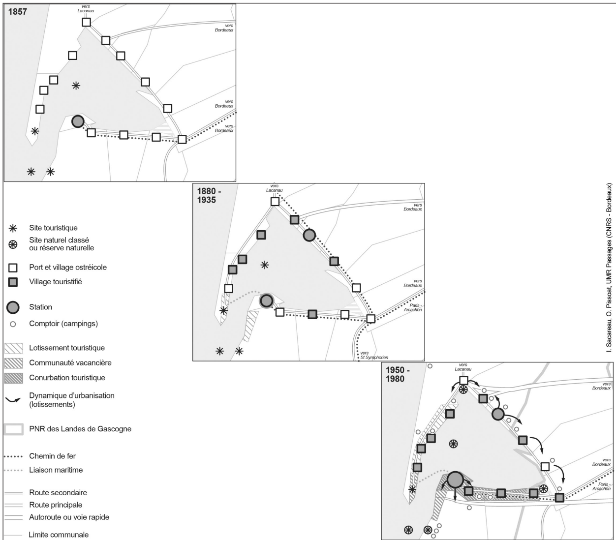
FIGURE 2 – Trois moments de la structuration spatiale du bassin d’Arcachon par le tourisme

tituée par un décret préfectoral de 1857 aux dépens de la commune de La Teste-de-Buch (Cassou-Mounat, 1975, p. 349) et se différencie ainsi d’autres villes d’hiver comme Nice ou Pau, et des lieux de villégiature balnéaire antérieurs, par le caractère volontariste de sa création. Elle introduit à la fois urbanité et centralité dans cet espace littoral longtemps marginalisé. Pendant près d’un demi-siècle après sa création, Arcachon polarise l’essentiel de la fréquentation touristique du bassin (200 000 touristes en 1914) et concentre l’ensemble des attributs de l’urbanité balnéaire (promenade, parcs et jardins, architecture urbaine, bonne