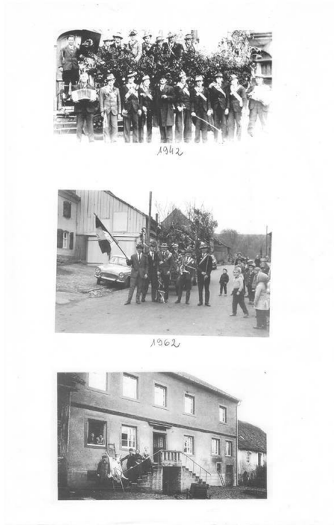
Photocopie de clichés de la Kirb , Delhingen.