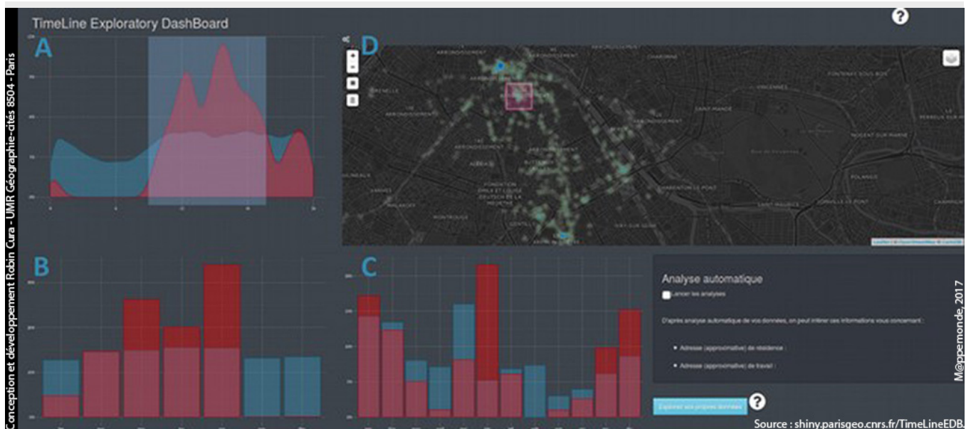
Figure 1. Copie écran de l'interface TimeLineEDB.

Cette application, TimeLineEDB ( figure 1 ), s'appuie sur des technologies libres 2 organisées autour du langage d'analyse de données R (R Core Team, 2016). Elle fait en particulier un large usage du package « shiny » (Chang et al. , 2017), qui permet la création d'interfaces graphiques dynamiques web.