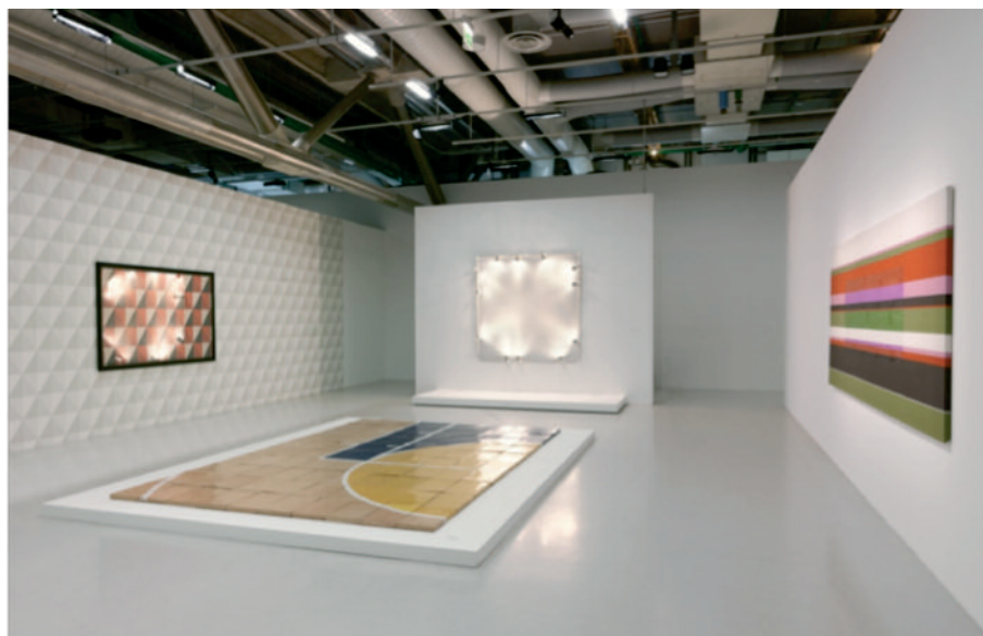
8 Bertrand Lavier, vue de l'exposition « Bertrand Lavier, depuis 1969 », Centre Pompidou, Paris, 2012. Photo : © André Morin. Avec l'aimable autorisation de l'artiste, de la Almine Rech Gallery et du Centre Pompidou

Au cours de la seconde moitié du xx^e siècle, l'abstraction s'est donc progressivement réifiée au point de devenir une imagerie à part entière, au même titre que la nature morte ou le portrait, c'est-à-dire facilement reconnaissable et se prêtant de ce fait aux caricatures. Ce processus de familiarisation visuelle que l'œuvre de Bertrand Lavier semble, à plusieurs égards, commenter, s'est accompagné d'un autre phénomène – dont se saisit également le plasticien français. Puisque l'abstraction est devenue pour le spectateur du xxi^e siècle un répertoire de formes relativement connu, voire banal, ce dernier peut être de plus en plus tenté de rapprocher des formes du réel, de son quotidien visuel, de ce répertoire-là. Pourquoi, en effet, un logo ne pourrait-il pas être perçu comme un objet inspiré par l'histoire de l'abstraction ? Le fossé qui semblait autrefois immense entre les objets réels et le vocabulaire pictural non-figuratif s'est aujourd'hui considérablement réduit et nous incite à poser un nouveau regard sur toutes ces choses composées d'images, potentiellement abstraites. À cet égard, le travail de Bertrand Lavier nous permet d'en redécouvrir un certain nombre sous un angle désormais formel, plastique, et non plus seulement utilitaire.