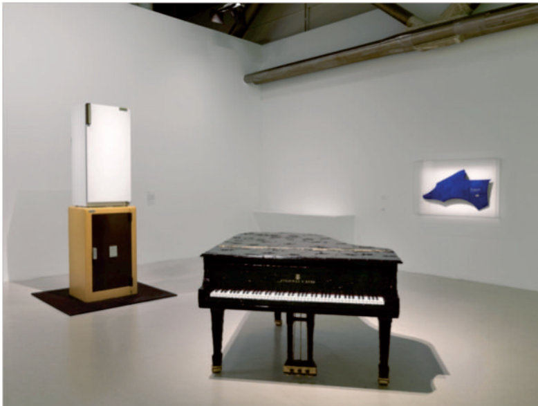
4 Bertrand Lavier, vue de l'exposition «Bertrand Lavier, depuis 1969», Centre Pompidou, Paris, 2012.

La production du plasticien français est traversée par la volonté d'interroger et de déstabiliser nos habitudes de perception artistique en nous confrontant, nous spectateurs, à des œuvres qui révèlent une différence troublante entre la réalité du langage et la réalité matérielle. Et cet intérêt pour la matérialité, qui se traduit par l'efficacité plastique de ses propositions artistiques, l'éloigne un peu plus des peintres américains, souvent plus intéressés par l'image ( picture ) et ses conventions de lecture. Chez Bertrand Lavier, la mise en avant d'un écart entre réalité du langage et réalité matérielle, entre idée et chose, repose sur de multiples procédures de transposition, de traduction et d'appropriation. Les objets peints par exemple (série commencée en 1980) sont bel et bien des objets peints, mais il faudrait préciser que, après avoir été peints industriellement, ils ont été recouverts de peinture par l'artiste, avec une touche dite Van Gogh (qui lui est pourtant très personnelle). Face à de telles pièces, le langage du théoricien de l'art peut rapidement s'épuiser en circonvolutions pour