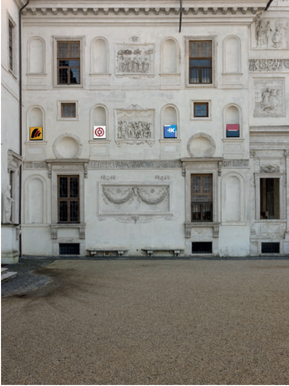
3 Bertrand Lavier, Sociétés Générales (détail), 2008, vue de l'exposition « Bertrand Lavier Roma », Villa Médicis, Rome, 2009.

yeux d'un certain nombre de spectateurs n'ayant pas le même bagage visuel que l'artiste)? C'est exactement cette interrogation que Bertrand Lavier soumet au spectateur, et plus particulièrement à l'historien de l'art, dans sa série Sociétés générales (2008, ill. 3) dans laquelle il isole les logos de multiples banques. Face à de telles œuvres, la distinction abstraction/figuration, déjà considérée comme obsolète par un certain nombre d'artistes de la seconde moitié du xx e siècle, se délite. Car finalement, depuis un demi-siècle environ, la question de l'image a contribué à rendre caduc le débat qui opposait l'abstraction à la figuration. En effet, dans les années 1950-1960, la société de consommation, en s'accompagnant d'une culture de masse, rendue possible notamment par la large diffusion d'images papier et télévisées, a conduit de nombreux plasticiens – des peintres tout particulièrement – à s'interroger sur cette réalité de second degré qui, in fine , met au même niveau l'image abstraite et l'image figurative. Le référent ou l'absence de référent de premier degré de l'image source importe peu : au second degré, ces deux images appartiennent à une