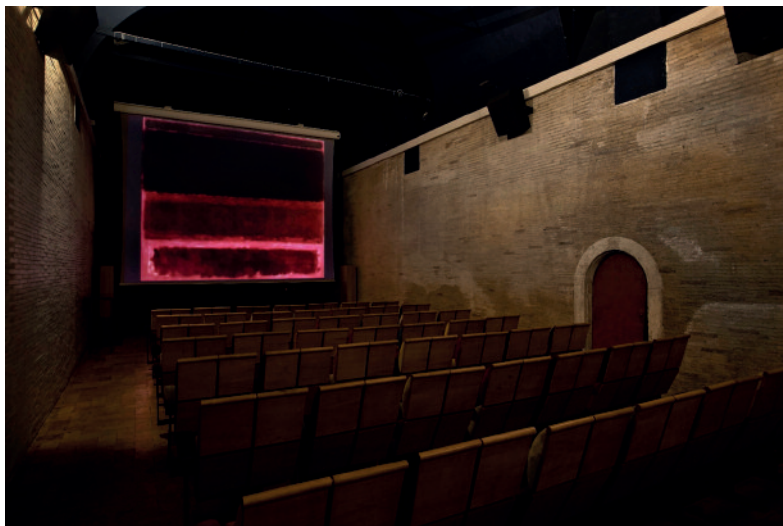
7 Bertrand Lavier, Four Darks in Red , 2004, vue de l'exposition « Bertrand Lavier Roma », Villa Médicis, Rome, 2009, projecteur, film couleur 35 mm transféré sur DVD, 5 min 35 sec, écran 2,5 × 3 m. Photo : © Claudio Abate. Avec l'aimable autorisation de l'artiste, de la Almine Rech Gallery, de la Villa Médicis et de Claudio Abate

« bougé » presque imperceptible, qui redouble l'impression de flottement suscitée par les tableaux de Rothko. Le trouble au sens propre existe également au sens figuré puisque le spectateur, croyant s'arrêter pour regarder une image en mouvement, découvre une image quasi fixe d'un tableau qui se révèle presque animé. Cette démonstration, particulièrement séduisante en raison du choix de l'œuvre filmée, prend sa source en 1986, année au cours de laquelle Bertrand Lavier inaugure son chantier des tableaux filmés avec Cubist Movie , TV Painting et Accrochage , qui lui-même prend sa source dans ses Slide Paintings de 1978. Ces différentes œuvres reposent sur la mise en place d'un dispositif de présentation d'une reproduction (une image) d'un tableau réalisé par un autre artiste que Lavier – dans ces différents cas de figure, un peintre célèbre. Les œuvres en question ne sont pas toutes abstraites et sont issues de différentes époques. Néanmoins, Accrochage n° 1 et Accrochage n° 2 (1986) présentent par exemple un ensemble d'images de tableaux principalement abstraits (de Matisse, Léger, Malevitch, Lichtenstein et Pollock) projetés à taille réelle sur le mur grâce à des projecteurs super 8. L'histoire de la peinture moderne est réduite à une image, devenue ici également sonore.