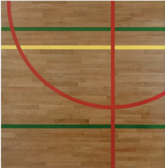
9 Bertrand Lavier, Composition rouge, verte et jaune , 1989, acrylique sur bois, 220 × 220 cm © Bertrand Lavier Avec l'aimable autorisation de l'artiste et de la Almine Rech Gallery

Ainsi, chez Lavier, un changement de point de vue, un certain conditionnement du regard permet d'envisager un court de tennis réel comme une composition abstraite. De la même manière, le dessin d'une partie d'un terrain de basket peut se transformer chez lui tantôt en tableau posé au sol, une conséquente épaisseur interdisant alors au spectateur de le fouler aux pieds ( Composition bleu, jaune, blanche , 2003, céramique, 400 × 300 cm, ill. 8, ici au sol), tantôt en tableau accroché au mur ( Composition rouge, verte et jaune , 1989, ill. 9). Des panneaux de signalisa-