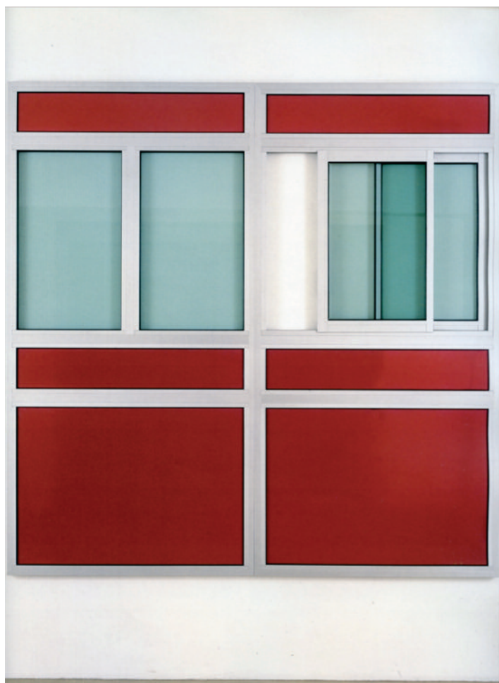
10 Bertrand Lavier, Relief-peinture n°2 , 1988, aluminium, tôle émaillée, verre, 250 × 250 × 10 cm © Bertrand Lavier Collection privée, Boulogne Avec l'aimable autorisation de l'artiste et de la Almine Rech Gallery

tion repeints avec la fameuse touche matiériste typique de Bertrand Lavier constituaient les premières Compositions , chantier qui s'est poursuivi avec d'autres œuvres du même genre, au titre néanmoins différent, à l'instar de Paragon (1986) ou Donnay n°1 (1989), présentant dans les deux cas le plateau d'une table de ping-pong repeint.