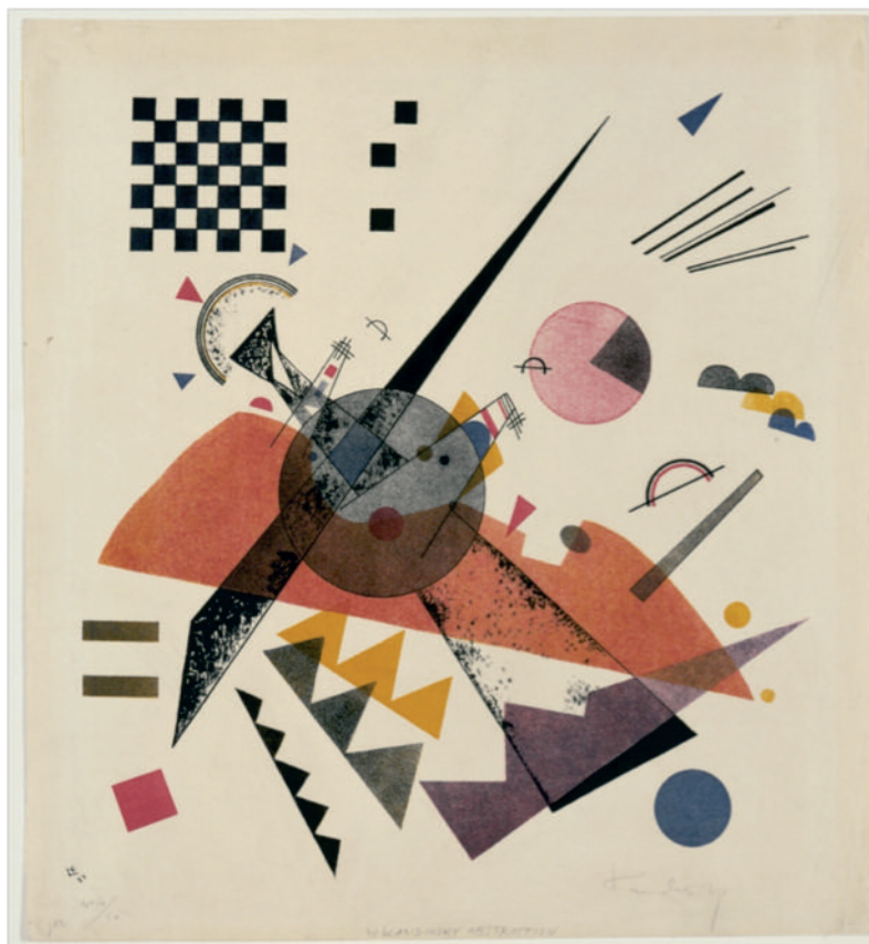
1 Vassily Kandinsky, Orange , 1923, lithographie sur papier, 40,6 × 38,3 cm, Museum of Modern Art, New York

1915, ill. 2); de même que la croissance des fleurs fut une puissante source d'observation pour Kupka ( Conte de pistils et d'étamines n° 1 , 1919-1923), etc. Néanmoins, ces références ne se veulent pas visibles au premier regard. Elles appartiennent avant tout au peintre. Par conséquent, il faudrait s'en tenir au premier constat d'une absence de références précises et évidentes à des éléments d'une réalité potentiellement observable pour définir la spécificité des œuvres abstraites. Cette observation a cependant souvent conduit le spectateur à conclure trop hâtivement que l'art abstrait était, par nature, un art coupé du monde extérieur, se recentrant sur des questions purement esthétiques, autrement dit refermé sur lui-même. Par voie de conséquence, il a pu être jugé abscons, sinon purement décoratif.