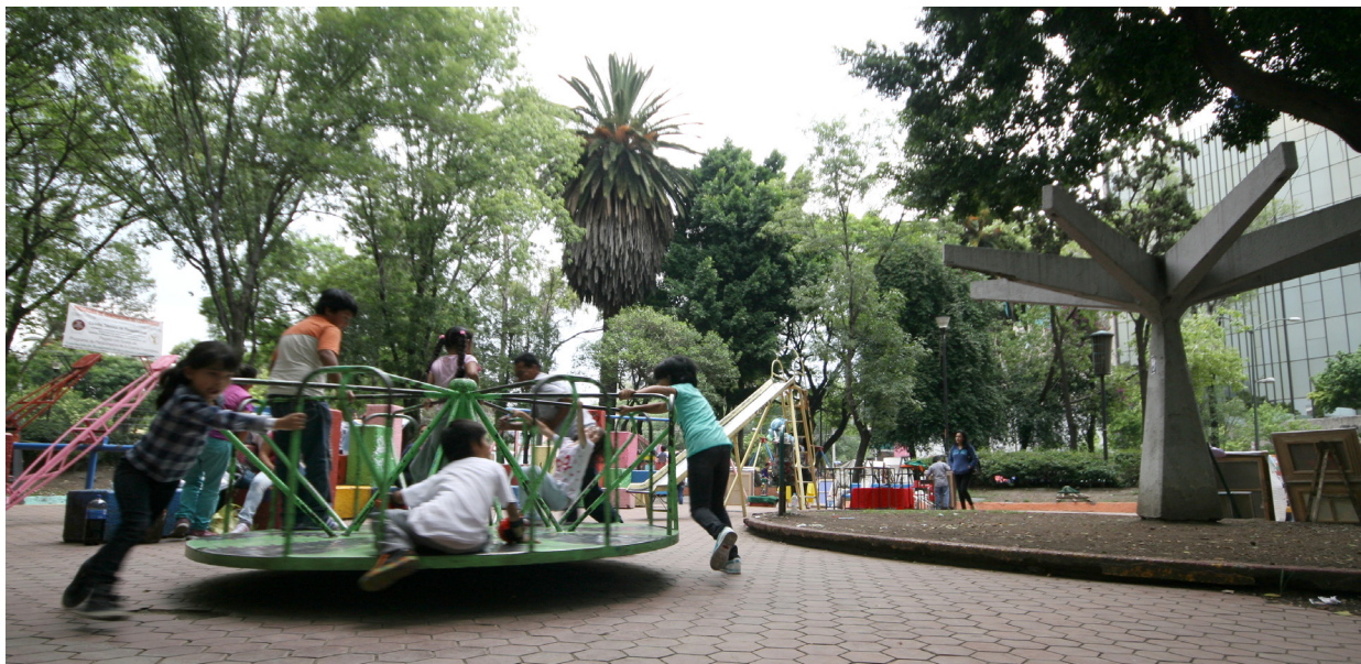
Jardín del Arte, Delegación Cuauhtémoc

décembre 2016 aux fonctionnaires ayant participé aux entretiens, puis à un public plus large lors d'une présentation dans les locaux de l'institution du gouvernement de la ville de Mexico ayant collaboré à sa réalisation. Depuis lors, le livre est disponible en accès libre sur internet 4 .