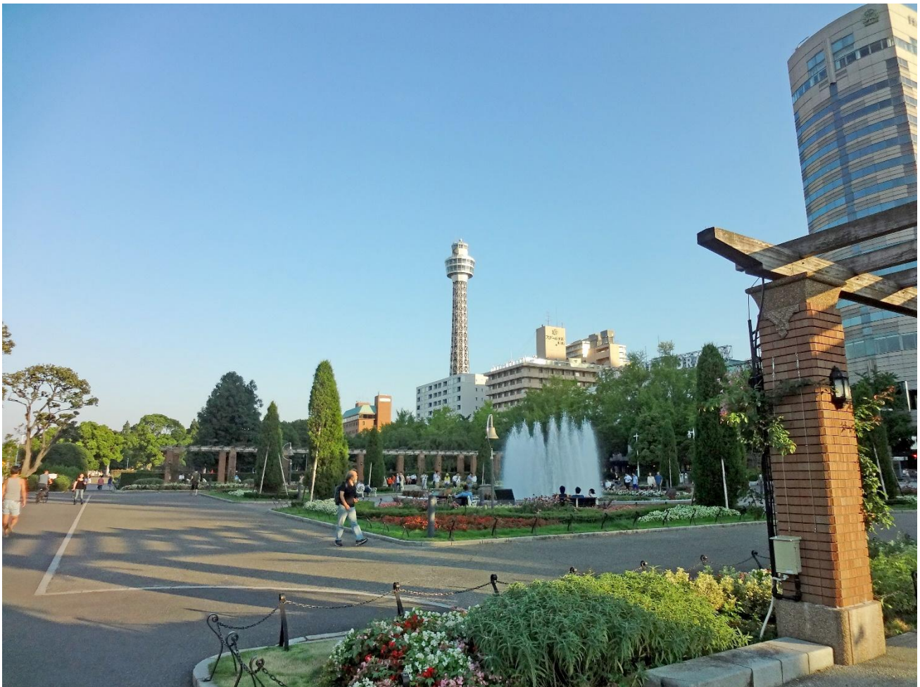
Fig. 3 : Le parc Yamashita à Yokohama

Ces aménagements sont complétés par les premiers parcs et jardins publics, comme celui d'Ueno, mais aussi ceux implantés dans les quartiers réservés aux étrangers, à Kannai (Yokohama) ou Kawaguchi (Ôsaka). On vient y observer et s'accoutumer aux pratiques et aux normes en vigueur dans les espaces publics européens. Par la suite, le parc Yamashita, 7,4 ha à Yokohama, construit avec les déblais du séisme de 1923, est une des premières promenades de front de mer au Japon. Japonais et résidents de la communauté étrangère, nombreux dans la ville, se mêlent, autour du décor urbain qu'est le port.