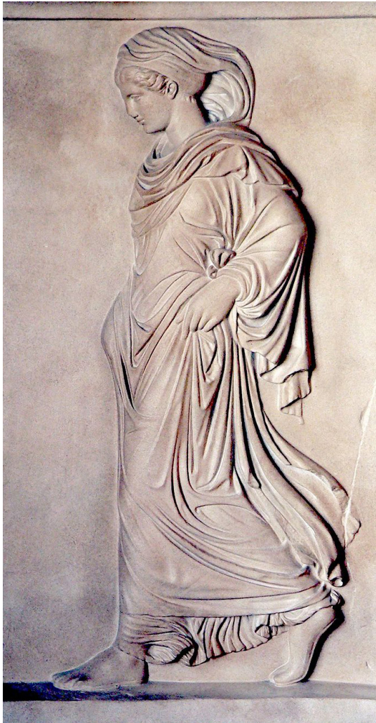
FIG. 1 — La Gradiva . Partie du bas-relief des Aglaurides (musée Chiaramonti à Rome) Inv. 1284.