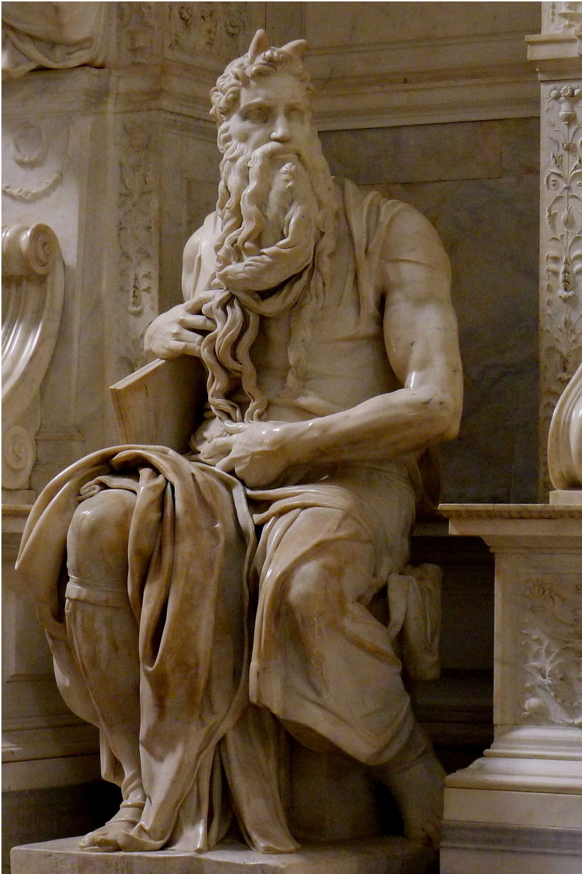
FIG. 2 — Moïse, MICHEL-ANGE, Saint-Pierre-aux-Liens, Rome (1505-1545).