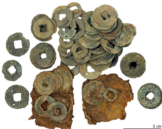
Figure 1 - Monnaies découvertes dans la tombe n° 6.

Les monnaies découvertes sont chinoises, à l'exception de onze d'entre elles qui sont japonaises. L'examen des inscriptions monétaires permet de les dater des Song du Nord (960-1127) et des Qing (1644-1911). Les monnaies japonaises, des Kan'ei tsuho 寛永通寶, ont été produites entre 1626 et 1867. Les plus anciennes du corpus sont des Jing De yuanbao 景德元寶 (1004-1007) et les plus récentes des Guang Xu tongbao 光緒通寶 (1875-1908).