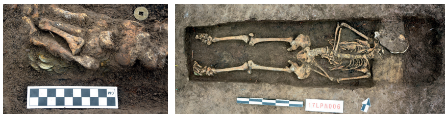
Figure 3 - Tombe n° 6 et détail du pied gauche.