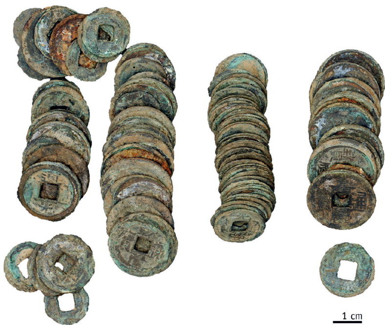
Figure 2 - Monnaies découvertes dans la tombe n° 13.