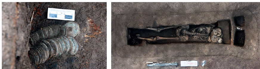
Figure 4 - Tombe n° 13 et détail de la ligature.