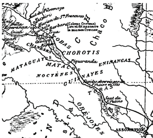
Mapa 1. Detalhe do “Mapa para seguir a viagem de M.A. Thour à procura dos restos do Doutor Crevaux” (1883).