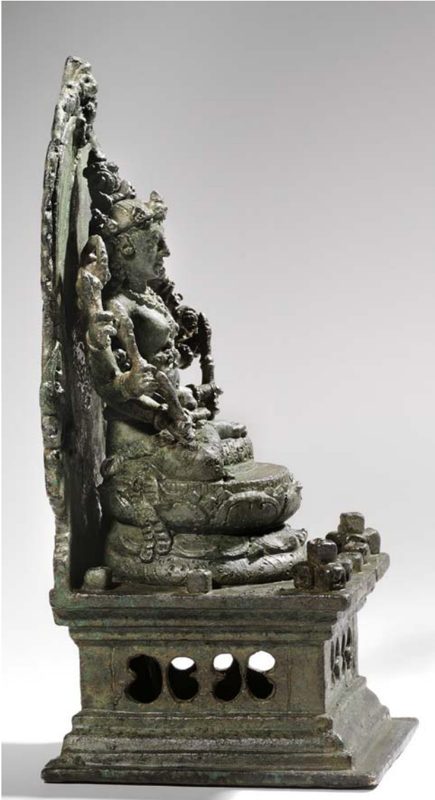
Abb. 3 Seitenansicht der Bronze in Abb. 1.