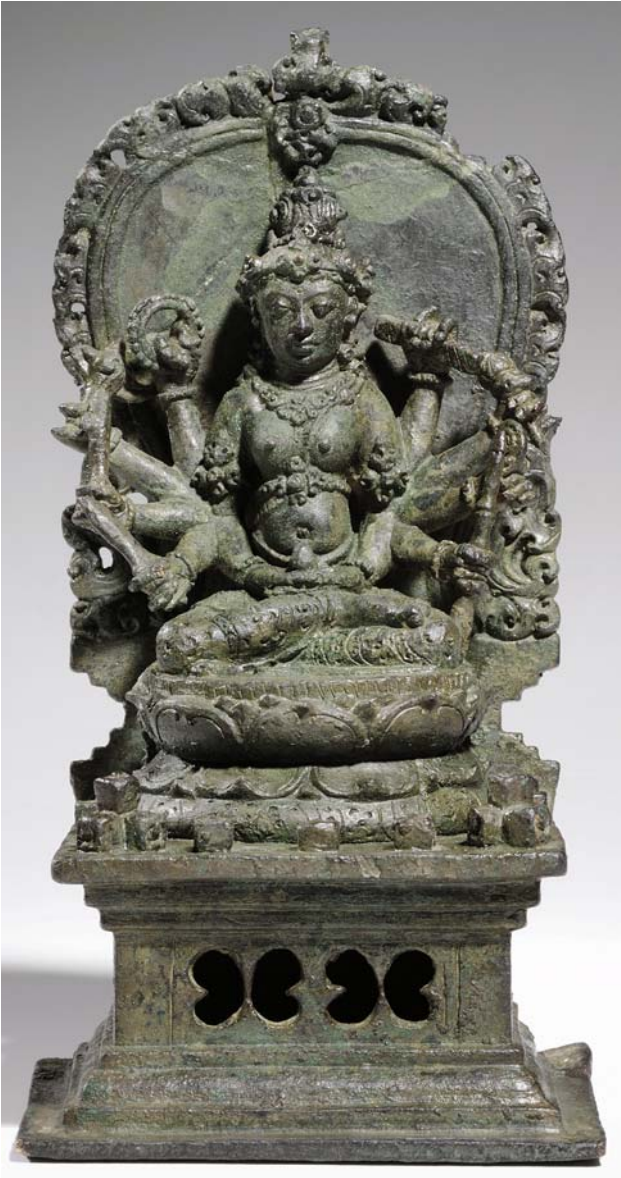
Abb. 1 Mahāpratisarā, Zentraljava, Bronze, 15,0 × 7,5 cm, Museum für Asiatische Kunst, Berlin, Inv.-Nr. II 196. © Staatliche Museen zu Berlin, Stiftung Preußischer Kulturbesitz, Museum für Asiatische Kunst, Kunstsammlung Süd-, Südost- und Zentralasien. Photo: Jürgen Liepe

Mantras näher betrachten. Das Figürchen soll vom Caṅḍi Lara Jonggrang stammen. Es kam 1881 nach Berlin und wurde unter Nr. Ic 10252 erfasst.“ 3)