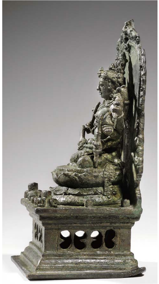
Abb. 4 Seiteansicht der Bronze in Abb. 1.

„Es wird unmittelbar auffallen, dass, wegen der Verbesserung, die es für unsere Vorstellung vom buddhistischen Zentral-Java bringt, auch dieses Figürchen ein wichtiges Exemplar genannt werden darf. Kein frommes Gebet, sondern ein Zauberspruch der Art, die wir überall in Tibet finden und die in den Augen der Buddhismus-Verehrer dem Buddhismus dort eine minderwertige Note gegeben hat.“ 5)