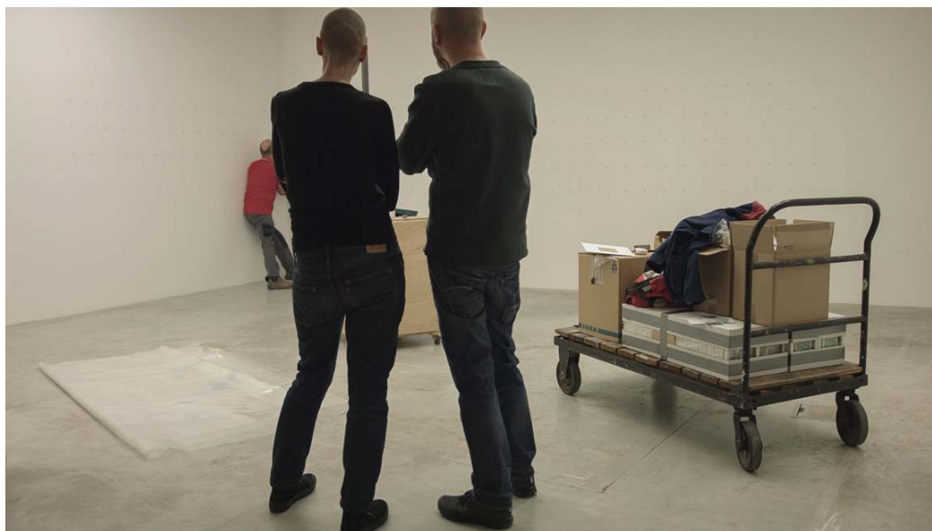
Fig.2 : Deux artistes supervisent la mise en place de leur prochaine exposition au musée d'art contemporain de Ljubljana (MSUM)