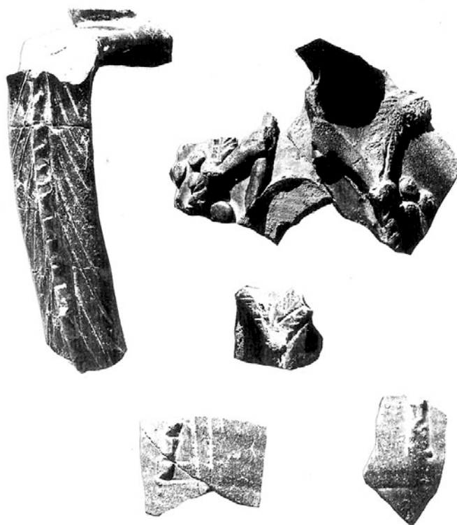
Fig. 3 — Cadrix. Vase à décor plastique et incisé.

technique décorative ne sont cependant pas sans rappeler ceux observés sur les grands pots conservés au Musée de Rome où l'on retrouve des décors d'arcades et de colonnes de tradition classique (MAZZUCATO 1972/25, Fig. 48-49) ou sur un grand vase daté du IV e siècle découvert à Milan (fouille du métro 1982-84, renseignement aimablement communiqué par M. Sannazaro).[70] Mais on peut également rapprocher la pièce de Cadrix a des vases de tradition gréco-byzantine "plain glazed ware" des IX-XI e siècles (TALBOT RICE 1930), sur lesquels se développent des décors plastiques naturalistes plus libres. [70]