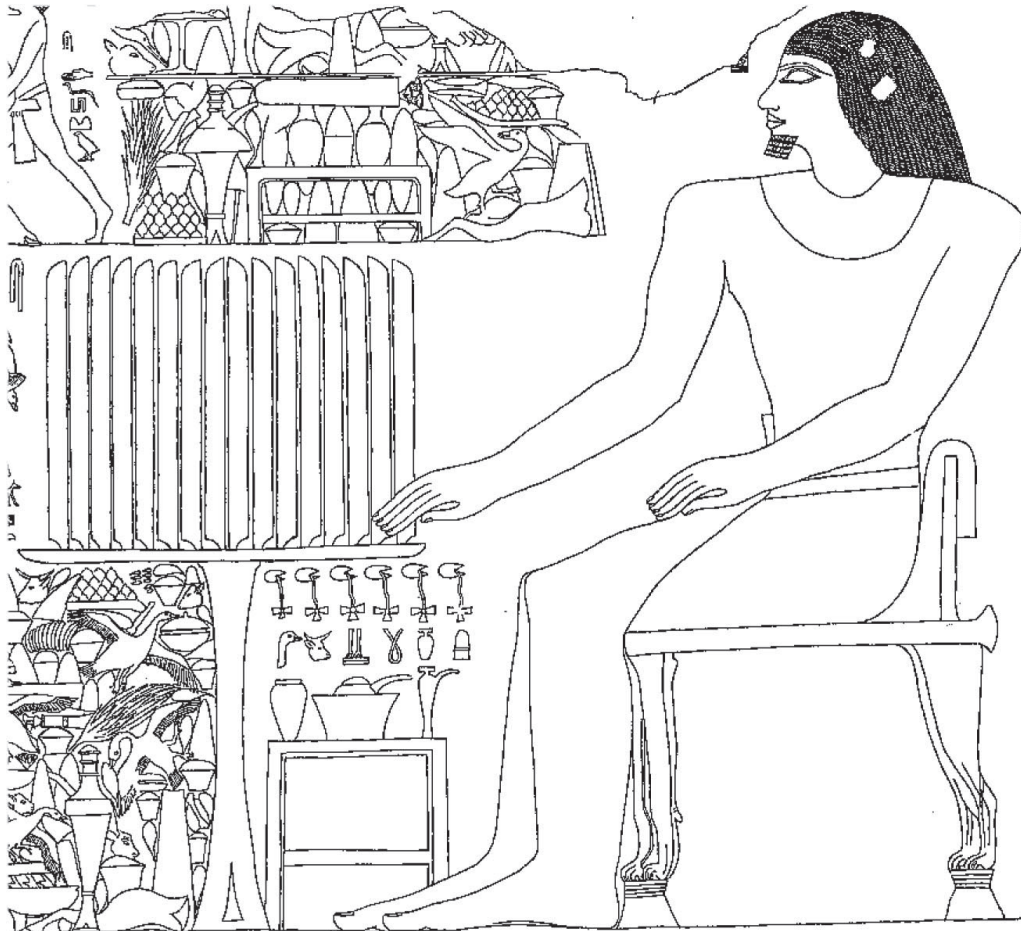
Fig. 3: Ptahhotep devant sa table d'offrandes (mur sud). D'après Harpur & Scremin 2008, p. 355.

Dans ces images, l'accumulation et la consommation de biens raffinés sont ainsi mises en valeur et fonctionnent comme des marqueurs élitaires 10 , outils de distinction sociale. Pour affiner notre perception de ces images, qui, rappelons-le, ornaient les parois des chapelles accessibles aux vivants venus perpétuer la mémoire posthume d'un défunt 11 , il faut tenter à présent de repérer dans les discours antiques la notion égyptienne qui pourrait constituer, pour un observateur de cette époque, le sous-texte implicite de l'image.