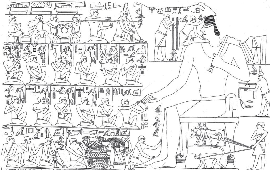
Fig. 1 : Ptahhotep (Saqqâra, D64). Scène du « petit lever » (mur nord de la chapelle, au-dessus de la porte). D'après Harpur & Scremin 2008, p. 354.

Devant celui-ci se déploient, sur quatre registres horizontaux superposés, d'autres scènes. De haut en bas, on peut signaler : la préparation et la présentation des ornements du seigneur (notamment des colliers ousekh ) et un récital musical, le défilé (sur deux registres) du personnel associé à la gestion du domaine agricole, avec, très vraisemblablement, la présentation d'un document écrit au seigneur 7 , enfin, la présentation de nourriture accompagnée de musique. Il semble que cette portion de la décoration, représentant les activités matinales du seigneur (soin et ornement du corps, alimentation, et premiers comptes rendus administratifs), illustre certains aspects considérés comme représentatifs de l'existence d'un membre de l'élite égyptienne.