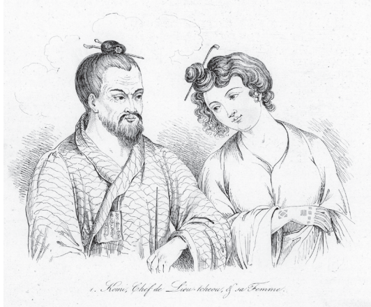
Fig. 1. Un couple romantique. Illustration du Voyage pittoresque autour du monde de Dumont d'Urville (1834-1835), composée à partir de deux figures séparées accompagnant le récit de voyage de Frederic Beechey (1831).