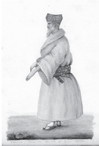
Fig. 2. Kuja aji , le représentant du gouvernement de Shuri à la négociation d'Unten avec l'amiral Cécille.

aux ordres du capitaine de vaisseau Nicolas Guérin, jeta l'ancre à Naha le 2 mai 1846 avec à son bord un nouveau missionnaire, Pierre Leturdu. Un mois plus tard, après avoir effectué des relevés sur la côte ouest de l'île, Guérin – sourd à la prière des autorités de n'en rien faire 19 – appareillait pour la baie d'Unten 運天湾, sur le versant nord de la presqu'île de Motobu 本部半島, lieu de concentration choisi par Cécille pour son escadre. Deux autres navires, le vaisseau amiral La Cléopâtre et La Victorieuse , ne tardèrent