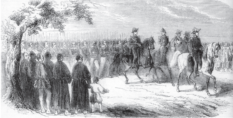
Fig. 6. Débarquement de l'amiral Guérin à Tomari en novembre 1855 (T. Aubé, L'Illustration , 15 mars 1856).

À Paris, les ministères des Affaires étrangères et de la Marine suivaient de près les mouvements des marines britannique et américaine. Ayant eu connaissance des avantages concrets déjà obtenus par le commodore Perry aux Ryūkyū 32 , le ministre de la Marine et des Colonies demanda, dès juin 1854, au commandant de la station navale de la mer de Chine d'en obtenir de semblables pour la France. Mais l'entrée en guerre contre la Russie – ce que l'histoire retient sous le nom de guerre de Crimée – mobilisa alors les navires français de la mer de Chine pour la traque des navires russes, du nord du Japon au Kamchatka. Ce n'est donc pas avant novembre 1855 que Nicolas Guérin, promu contre-amiral, put rassembler une escadre de trois bâtiments, La Virginie , La Sybille et Le Colbert , pour se rendre à Okinawa. Il y avait à leur bord quinze cents hommes au total, dont plus d'une centaine de Chinois. Décidé à faire montre de force, l'amiral débarqua en paradant à cheval à la tête de ses troupes 33 (fig. 6). Les officiels chargés de le recevoir, toujours des substituts aux autorités réelles, se montrèrent malgré