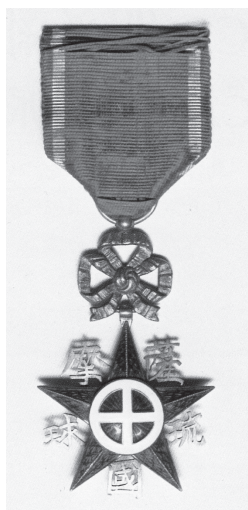
Fig. 8. Médaille célébrant la présence de Satsuma et du royaume des Ryūkyū à l'Exposition universelle de Paris en 1867. Pour l'occasion, le titre de roi des Ryūkyū fut attribué au daimyō de Satsuma (Musée Reimeikan 黎明館, Kagoshima).

Satsuma Ryūkyū koku 50 (fig. 8). Le plan de l'exposition montre du reste une allée de Liou-Kiou longeant les pavillons de Satsuma et de la Chine 51 .