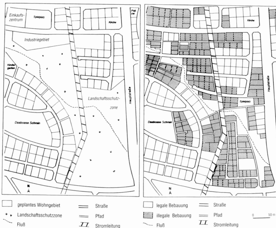
Fig. 3 Geplante Landnutzung in Bremen, 1979 / Planned Land Use in Bremen, 1979