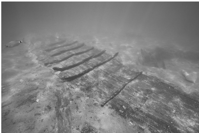
FIG. 5. – L'épave cousue Caska 1.

de 18 cm. Les membrures, assemblées au bordé au moyen de gournales, sont espacées de 47 cm en moyenne. La carlingue, longue de 6,75 m, est encastrée sur les varangues et porte dans sa partie proche de la proue une emplanture rectangulaire (long. 15 cm) entourée de cavités qui servaient à loger le pied du mât et les planches du fourreau d'étambrai. Les réparations sont nombreuses et comportent des tenons de réparation insérés dans des ouvertures quadrangulaires réalisées depuis la face intérieure des virures et des petites planches simplement clouées sur la membrure. Par ailleurs, des taquets en bois ont été parfois ajoutés à l'intérieur de la coque afin de mieux fixer ces réparations.