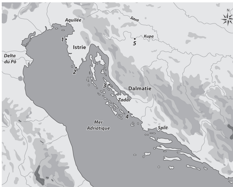
FIG. 1. – Localisation des sites où se sont déroulées des recherches en Croatie : 1. Zambratija ; 2. Pula ; 3. Caska ; 4. Pakoštane ; 5. Kamensko (carte V. Dumas, AMU-CNRS, CCJ).