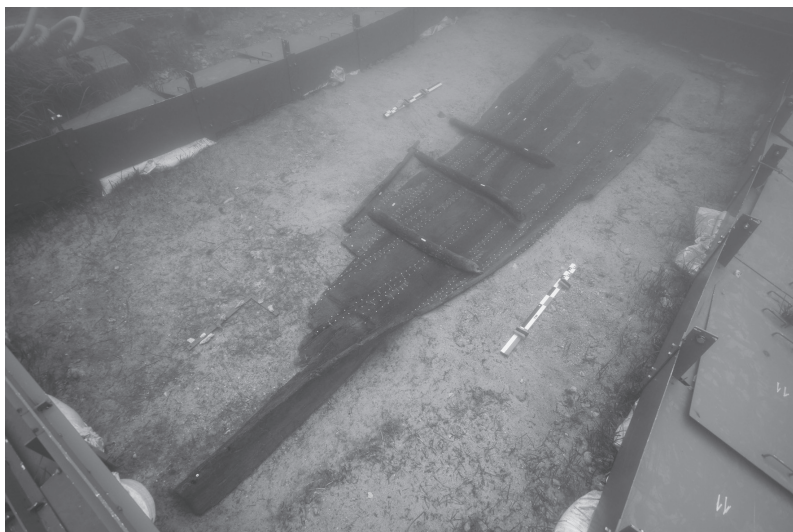
FIG. 2. – Vue de l'épave coulee de Zambratija.