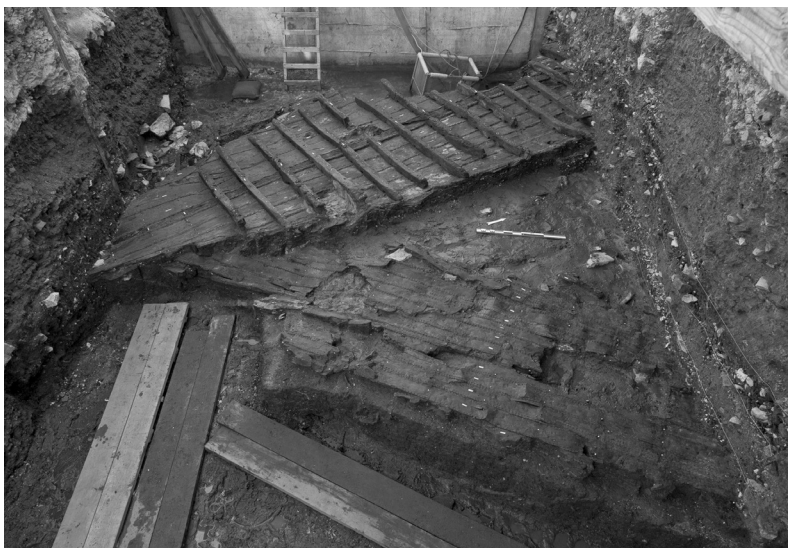
FIG. 4. – La tranchée de fouille rue Flaciousova à Pula avec les épaves Pula 2 (au premier plan) et Pula 1.