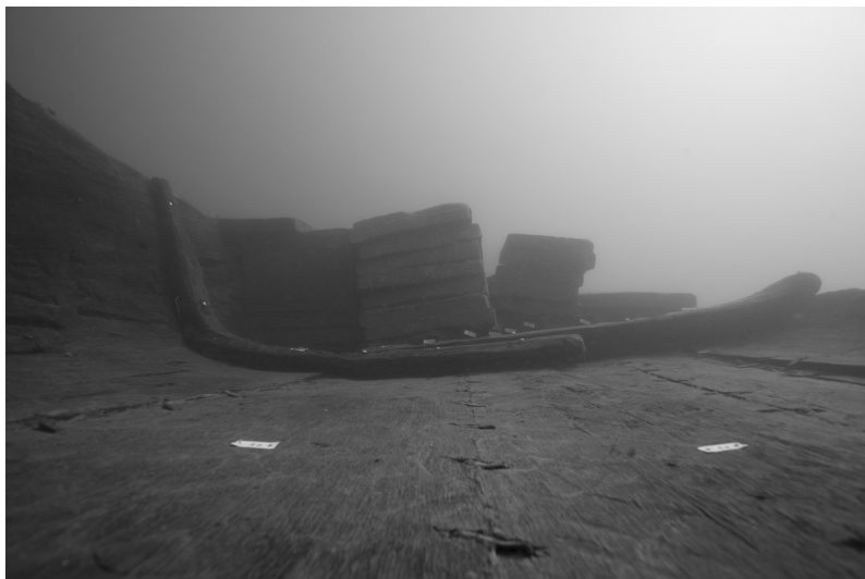
FIG. 7. – Vue en section du chaland à fond plat Kamensko I . On note la membrure constituée de deux courbes accolées et, à l'arrière-plan, les piles de briques.

Dans la zone fouillée, l'épave conserve quatre membrures espacées en moyenne de 1,5 m. Ces membrures sont constituées de deux courbes accolées issues d'embranchements. Elles sont assemblées à la sole et aux flancs par un nombre limité de gournables.