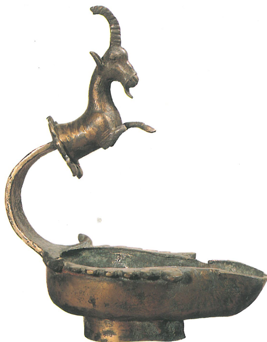
Lampe en bronze au manche terminé par un protome de bouquetin (ibex). Musée de Sanaa.

tuaire aux oracles renommés. Ainsi, par ce carrefour, s'opèrent des échanges qui placent La Mecque dans le circuit de l'économie internationale, tandis que les pèlerinages contribuent à atténuer le cloisonnement tribal. La mémoire encore imprégnée des tentatives d'union en grandes confédérations, les marchands de La Mecque tentent par l'Islam de refaire l'unité des Arabes du Nord et du Centre. A la fin du VII e siècle, leur victoire consacre l'instauration d'un État unique dans la péninsule arabique.