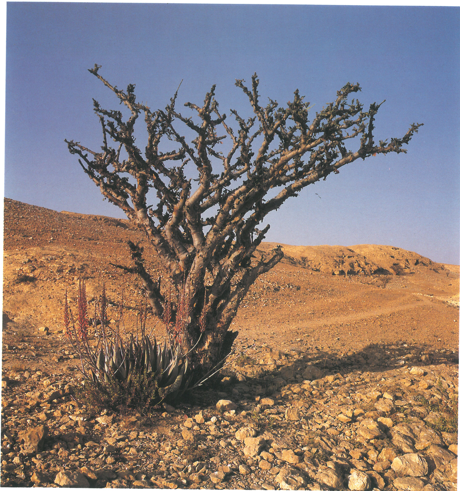
Arbre à myrrhe. Région de l'Hadramaout. Yémen.