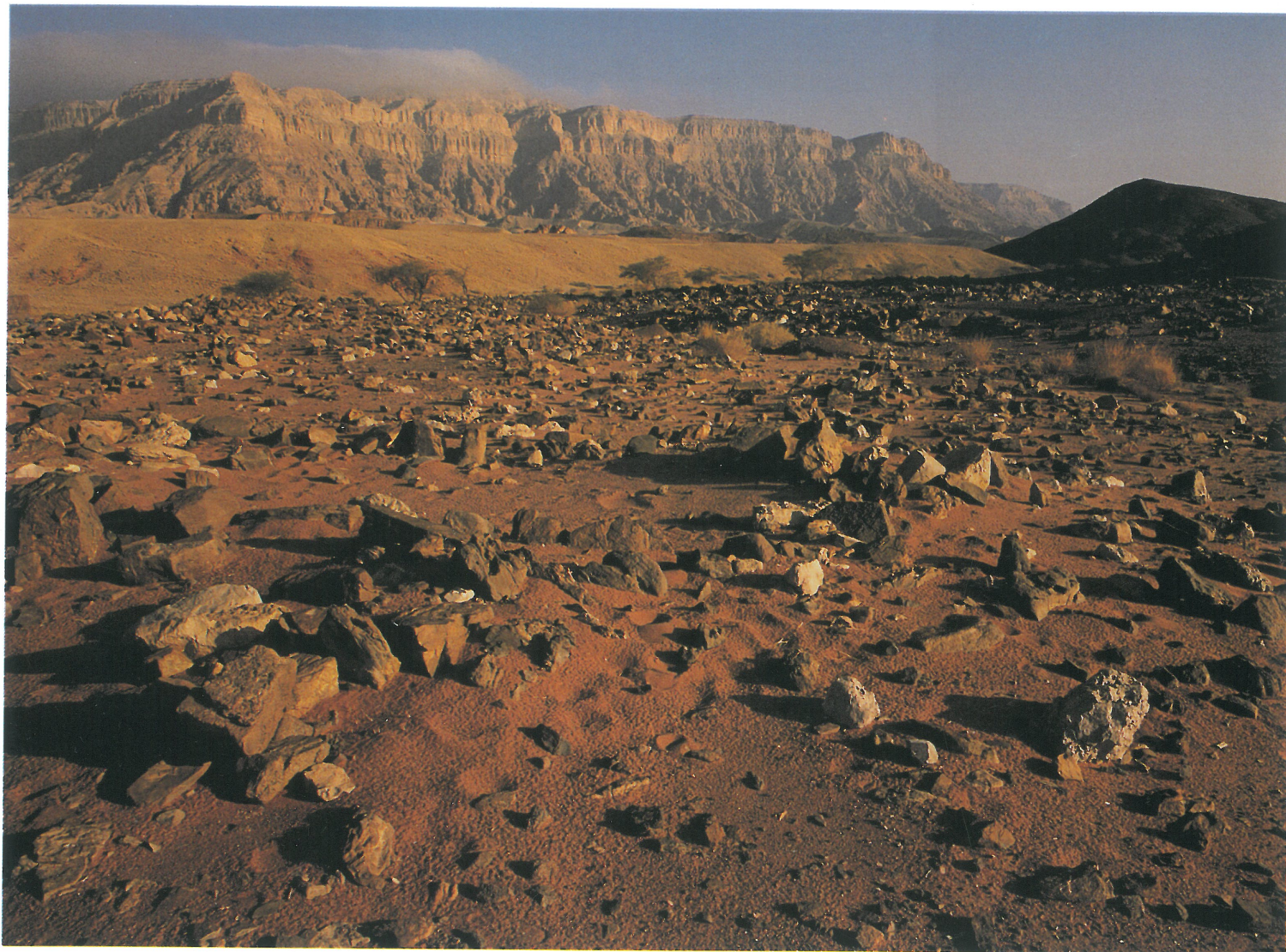
Mines du roi Salomon à Timna'. Nord-ouest d'Eilat. Israël.