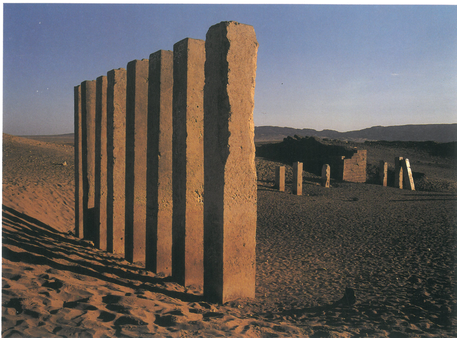
Mârib. Piliers du sanctuaire d'Almaqah partiellement dégagé en 1951. Yémen.