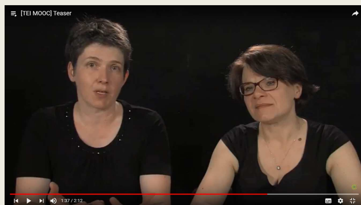
Fig. 1. Screenshot del "teaser" del corso

Il corso Scholarly Digital Editions: Manuscripts, Texts and TEI Encoding , tenuto da Marjorie Burghart (CNRS, Francia) ed Elena Pierrazzo (Università di Grenoble – Alpes, Francia) vuole colmare questa lacuna.