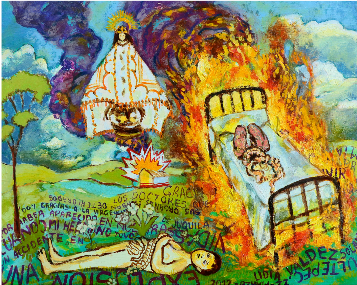
Figure 4 : Ángel Solano, serie Todos Santos , óleo sobre madera, 27 x 27 cm, 2015.

Entonces, desde estos paradigmas, los mexicanos festejamos todo lo que sea posible: a la madre (como primera y más importante figura en el altar de los santos laicos), y me detengo un poco en esta primera idea ya que merece ser desarrollada. La madre para el mexicano es el todo, es la imagen del origen, de la conexión con el pasado, pero también del sufrimiento más profundo; es la imagen de todos sus males y de todos sus deseos. “La imagen que el mexicano tiene de su madre es la de una mujer perfecta, una santa [...]. El mexicano no quiere atravesar el dolor de despedirse de su madre y, en cambio sufre permanentemente por ella [...]. El mexicano se vengará de su madre en otras mujeres y en toda otra estructura simbólica femenina” (Yépez: 66-68).