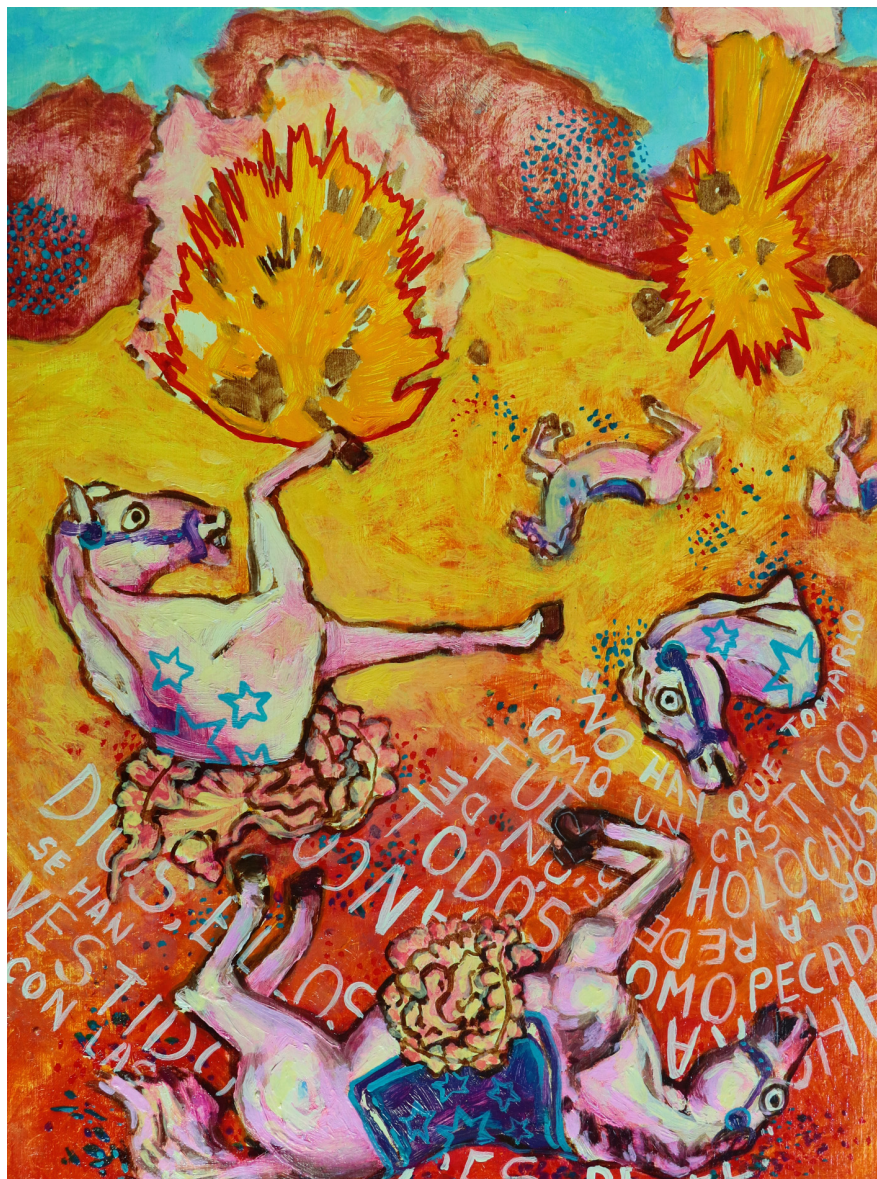
Figure 1 : Ángel Solano, serie Todos Santos , óleo sobre madera, 27 x 27 cm, 2015.

La serie Todos Santos se gestó a mediados del año 2015 como resultado de un profundo autoanálisis de mi producción anterior, en la cual mi preocupación fue hablar y reflexionar sobre el “cuerpo enfermo” en la sociedad actual y los mecanismos que se desarrollan en su entorno (antropológicos, sociales y económicos). Esta serie toma su nombre del pasaje Todos Santos. Día de Muertos del texto El Laberinto de la Soledad escrito por Octavio Paz publicado por vez primera en 1950. Todos Santos cuestiona las características del pensamiento contemporáneo mexicano y su relación con lo festivo a partir del acercamiento a un hecho violento (en este caso, accidentes por elaboración de pólvora). Es, sin más, un documento visual de la desmitificación, de la desaparición y muerte de todo lo que, como seres humanos, hemos construido, pero de igual forma es un archivo de la relación que lo anterior mantiene con formas místicas como los milagros, mostrando atisbos en el inconsciente por el deseo de aferrarnos a un ente u objeto que nos dé esperanza ante la deshumanización de las sociedades. El siguiente texto pretende analizar de manera concreta los puntos fundamentales de la relación que el mexicano mantiene con la fiesta y la muerte.