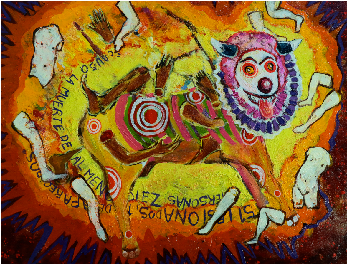
Figure 5 : Ángel Solano, serie Todos Santos , óleo sobre madera, 27 x 27 cm, 2015.

la joven por tener su fiesta y se inició una campaña mediática para poder lograr que Rubí celebrara. Mientras eso sucedía, la situación política y económica del país se descomponía. El tema obligado en las conversaciones cotidianas era la historia de telenovela de Rubí. Los medios masivos acababan de crear una “celebración colectiva” que involucraba directa o indirectamente a la mayoría de los mexicanos, con la finalidad de perpetuar su existencia como poder único. Todos celebraban a Rubí, como una metáfora de la realización colectiva, porque el mexicano es solidario en momentos trágicos. Ella logró realizar su fiesta, con la bendición y aportación de los sectores públicos y privados del país, y recibió regalos como viajes, autos, casas y una beca para ser actriz en la televisora que más la apoyó.