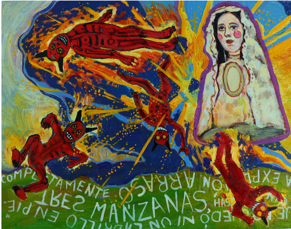
Figure 2 : Ángel Solano, serie Todos Santos , óleo sobre madera, 27 x 27 cm, 2015.

El gremio pirotécnico de Tultepec se creó en los últimos años del siglo XIX mediante la construcción de una agrupación religiosa conocida como Asociación de San Juan de Dios. El mito cuenta que un día su hospital se incendió. Juan de Dios entró varias veces a través de enormes llamaradas para sacar a los enfermos sin sufrir quemaduras. Así logró salvarles la vida a todos los pacientes. Como referencia al dominio del fuego por este santo, los pirotécnicos lo adoptan como patrono de su gremio y es la imagen que acompaña fiestas y accidentes relacionados con la pólvora. El 8 de marzo de cada año se le rinde culto y celebración como agradecimiento por salvarlos de una muerte por accidente. En dicho festejo se construyen toros pirotécnicos (artefactos de cartonería con elementos de carrizo, metal, papel y fuegos de artificio) que son remolcados por las calles principales del pueblo. Esta marcha festiva concluye con un ritual pagano donde se incendian las figuras en la plaza principal del pueblo (Solano).