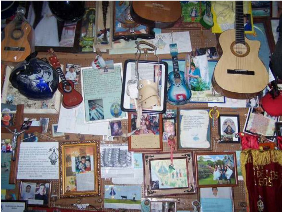
Paroi votive : caractère hétéroclite des objets en présence.