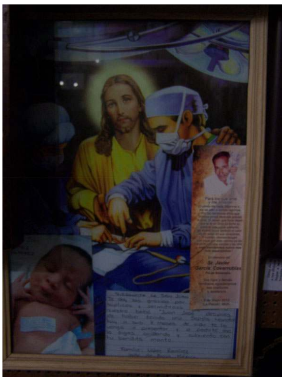
Poster du Christ posant sa main sur l'épaule du chirurgien.