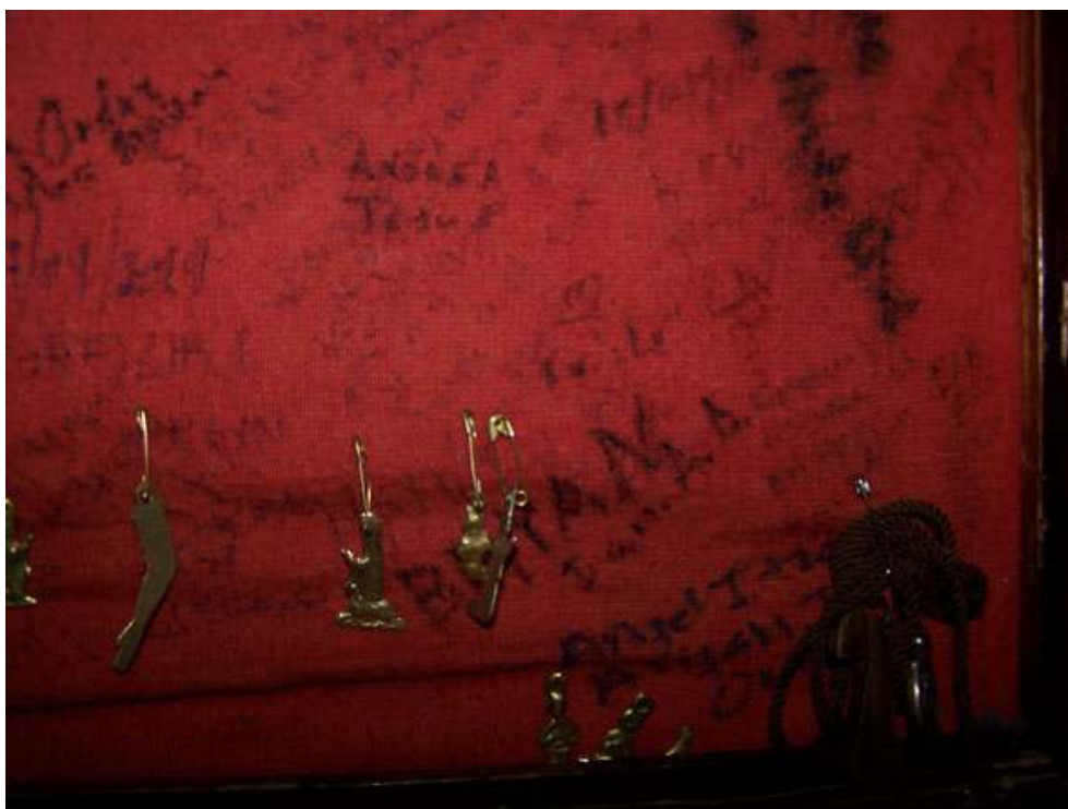
DISPOSITIF D'ACCROCHAGE MIS EN PLACE PAR LE CLERGÉ POUR CANALISER LE DÉPÔT DES DONS.