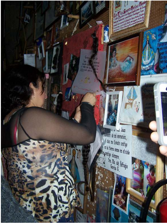
ACCOMPLISSEMENT DE LA PROMESSE PAR L'ACCROCHAGE DE LA TRESSE. SCÈNE PRISE EN PHOTO COMME PREUVE ET SOUVENIR.