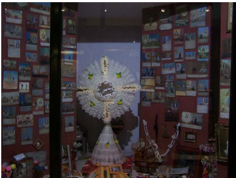
Vitrine des ex-voto dans le musée public.