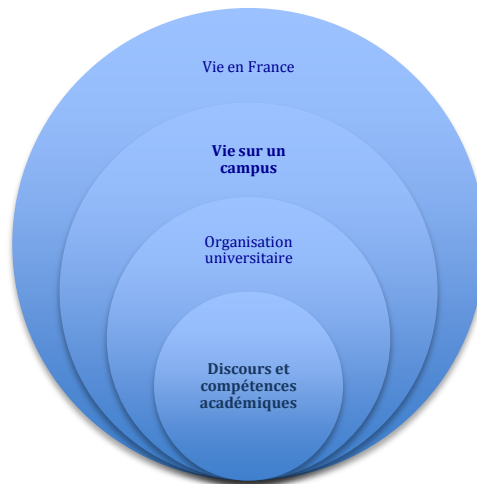
Figure 2 – Les différents champs du FOU

L'impossibilité de traiter tous les aspects du FOU dans un même programme conduit à traiter prioritairement tel ou tel aspect de manière à ce que les étudiants puissent en tirer un socle solide d'informations et de compétences. Tel programme donnera la priorité à la connaissance du fonctionnement de l'université française, tandis que tel autre s'orientera davantage vers le développement de compétences disciplinaires. C'est en cela que la représentation ci-dessus peut guider les concepteurs dans la construction d'un programme FOU.