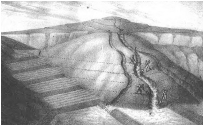
Fig. 1 Sistema della colmata toscana (reproduction de 1828) Source : Sulle colmate di monte , Cosimo Ridolfi