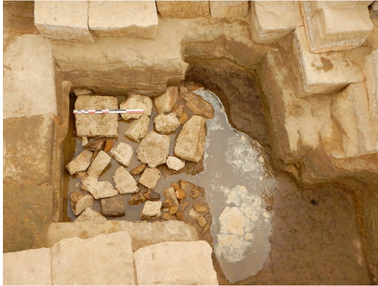
Fig. 4. Espace F3 : le fond de la fosse de fondation (à droite) et le niveau de remplis (059) dans le sable de rivière (062).

Dans le secteur des espaces F1, F2 et F4, le sable gris a été atteint ; il a été enlevé dans l'espace F1 afin d'atteindre le fond de la fosse de fondation. Contre le mur arrière du temple, une tranchée plus profonde a été pratiquée pour insérer les blocs, dont on a vu lors de la précédente campagne qu'ils formaient deux assises supplémentaires, ancrant ainsi plus profondément ce mur arrière par rapport aux autres murs du naos ; là encore, dans le sable est mêlé à une couche de fragments de grès et de calcaire (Fig. 5). Elle permet de comprendre que ce niveau de pierre a été placé dans la tranchée de fondation surcreusée dans la fosse, et que c'est le même procédé qui est présent en F3.