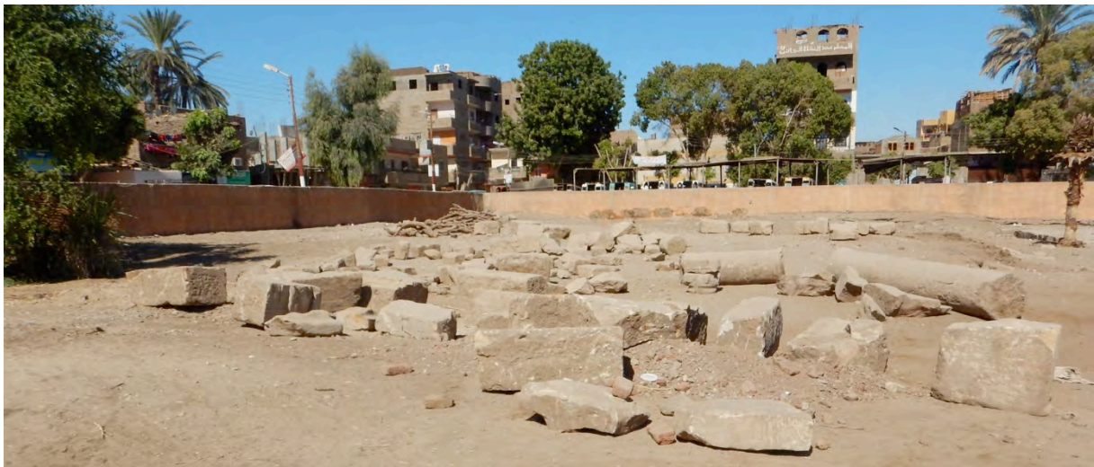
Fig. 13. Le secteur au nord de l'entrée du site, avec les blocs mis au jour en ville, avant les travaux.

La zone faisant face aux bureaux de l'inspectorat a été entièrement nettoyée cette saison. Les blocs gisant à cet endroit – notamment ceux découverts depuis plusieurs années lors de travaux urbains et transportés dans l'enceinte du temple – ont été entreposés sur quatre banquettes (10,5 x 1,5 m) construites au nord de l'entrée du site (Fig. 13-14). Les blocs ptolémaïques récemment découverts en ville ont été nettoyés et consolidés.