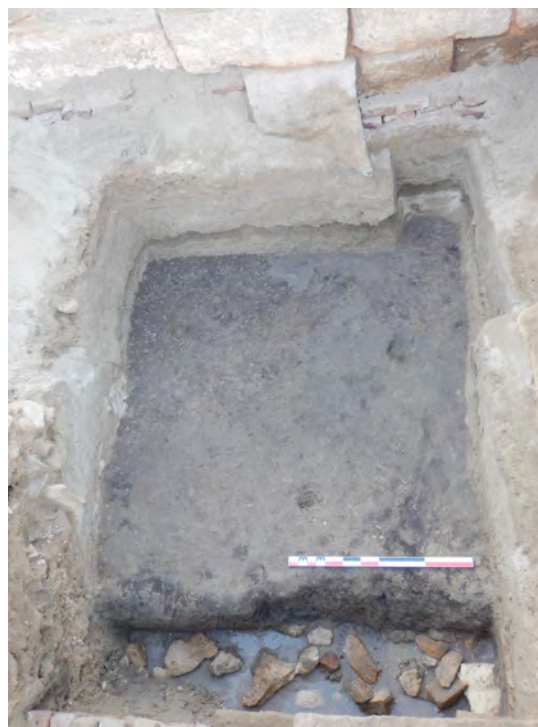
Fig. 5. La tranchée de fondation surcreusée en bordure du mur arrière du temple.

Dans le secteur des espaces F1, F2 et F4, le sable gris a été atteint ; il a été enlevé dans l'espace F1 afin d'atteindre le fond de la fosse de fondation. Contre le mur arrière du temple, une tranchée plus profonde a été pratiquée pour insérer les blocs, dont on a vu lors de la précédente campagne qu'ils formaient deux assises supplémentaires, ancrant ainsi plus profondément ce mur arrière par rapport aux autres murs du naos ; là encore, dans le sable est mêlé à une couche de fragments de grès et de calcaire (Fig. 5). Elle permet de comprendre que ce niveau de pierre a été placé dans la tranchée de fondation surcreusée dans la fosse, et que c'est le même procédé qui est présent en F3.