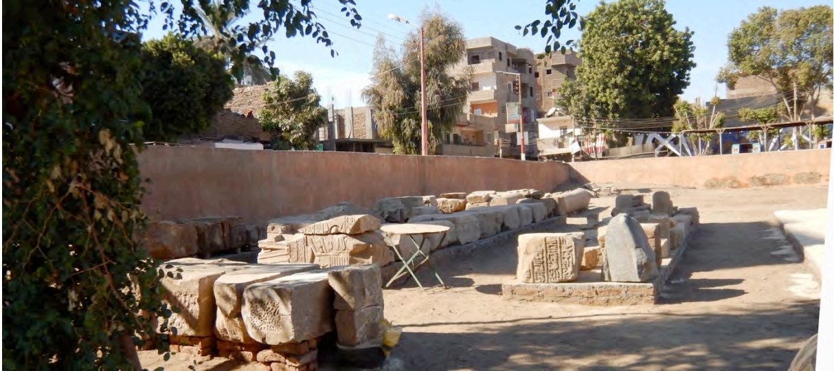
Fig. 14. Les banquettes installées au nord de l'entrée du site.