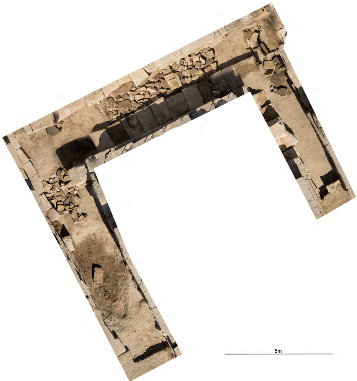
Fig. 7. Ortho-image du déambulatoire (E) autour de la cella, avec le niveau de remploi de blocs (065) dans le sable de fondation (062).

Une tranchée a été ouverte sur la bordure est du « pronaos ». Il est bien attesté que cette partie du temple a été bâtie à l'aide de remplois, en particulier aux noms de Thoutmosis III et d'Hatchepsout. Plusieurs blocs avec les faces décorées accessibles ont ainsi été mis au jour ( infra ). Après dégagement des débris de destruction, une épaisse couche de sable gris (071) a été mise en évidence ; il est associé à la fondation du mur péribole longeant le côté est du temple 2 .