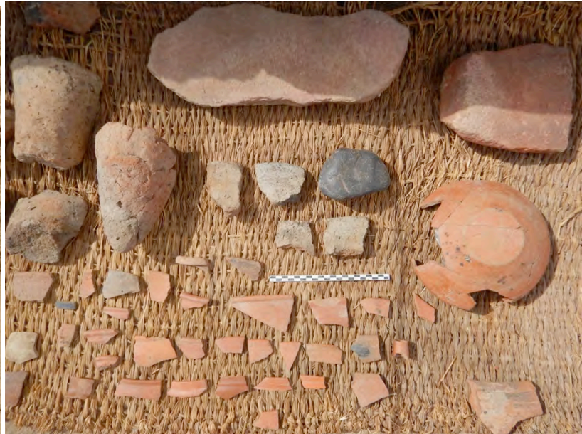
Fig. 8. Échantillonnage de céramiques Ancien Empire et de meules provenant de la bordure est du « pronaos ».

Il est désormais acquis que les fondations du naos et du « pronaos » ont entamé des niveaux archéologiques de l’Ancien Empire 3 . Le constat a été fait à nouveau dans la tranchée ouverte cette saison, la bordure orientale de la fosse de fondation du « pronaos » ayant entaillé des niveaux Ancien Empire, que l’on peut provisoirement considérer comme domestiques (Fig. 8). Dans la tranchée, le niveau (070) marquant le fond de la fosse a livré un important matériel céramique ( Meidum bowls , jarres à bière, moules à pain, meules, etc.) associé à