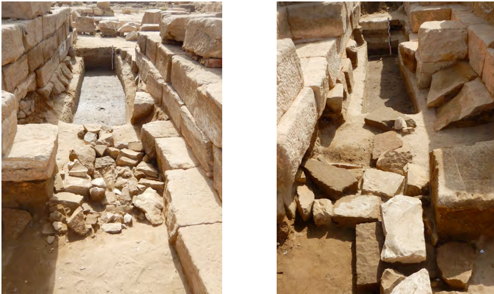
Fig. 6. Couloirs ouest et est du déambulatoire E : niveau de remplois (065) et sondage dans le sable de fondation.

Trois sondages ont été pratiqués pour atteindre le fond de la fosse de fondation (Fig. 6-7). Quelques tessons de l'Ancien Empire ont été collectés, sans lien avec des vestiges de structures. La couche (060) formant le fond de la fosse présente un aspect noirâtre, mais avec comparativement très peu de céramique par rapport au secteur du « pronaos » ( infra ).