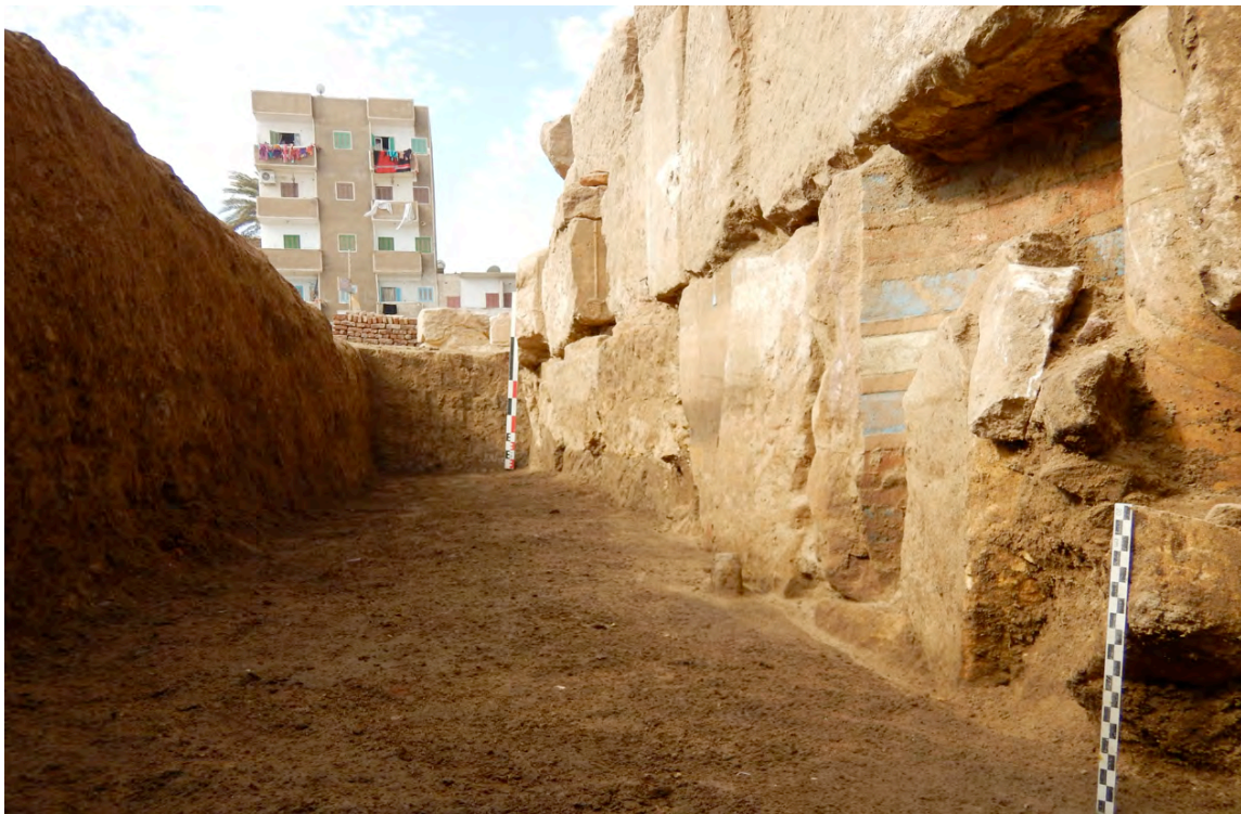
Fig. 9. Tranchée pratiquée le long de la façade du « pronaos ».

Une seconde tranchée a été ouverte contre la façade du « pronaos », dans la moitié est (Fig. 8). Des remplois Nouvel Empire ont également été mis en évidence ( infra ). Les niveaux Ancien Empire (073) ont été atteints, mais sans fournir beaucoup de matériel céramique. À proximité du puits copte, la partie d'un massif de briques crues (067) a été dégagée ; il est conservé sur 4,5 m de long et 0,96 m de large, et a été sectionné par la fosse de fondation du « pronaos ». Les briques sont de grandes dimensions (51 x 24 cm) ; la céramique associée à ce mur sera étudiée la saison prochaine, et devrait fournir quelques précisions chronologiques.