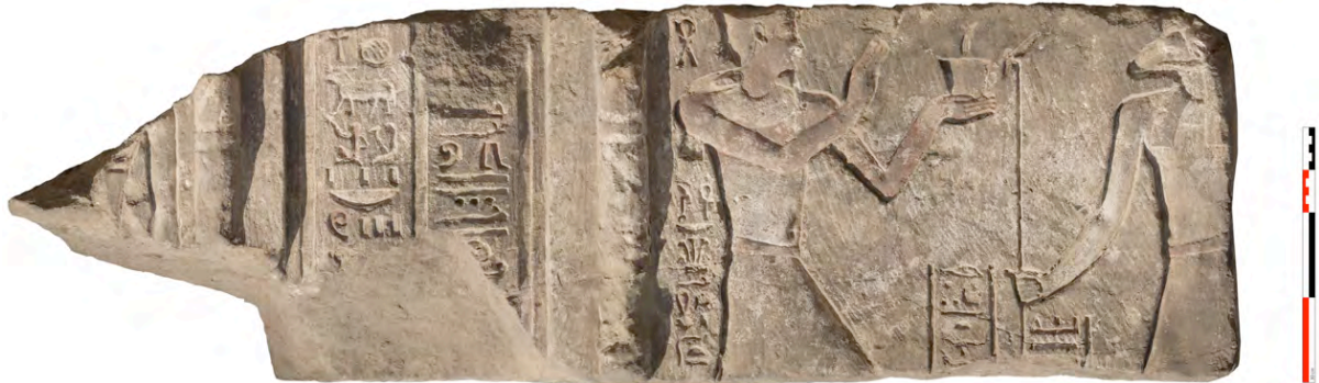
Fig. 3. Face externe d'un muret d'entrecolonnement.

À proximité du mur arrière du naos, les travaux ont été repris dans les espaces F1 et F3, où il s'est agi d'enlever l'épaisse couche de sable gris de rivière (062), et d'atteindre le fond de la fosse de fondation. À l'intérieur de l'espace F3, une couche de fragments (grès et calcaire) a été dégagée ; elle (059) avait déjà été observée dans la coupe pratiquée l'année passée. Cette couche de pierres (Fig. 4) a été mise en place au cours du remplissage de sable, au niveau de la première assise du mur arrière du temple ptolémaïque. Le niveau de la nappe phréatique a ralenti la progression du travail dans ce secteur, et les investigations devront être poursuivies au cours de la prochaine campagne à l'aide d'une pompe.