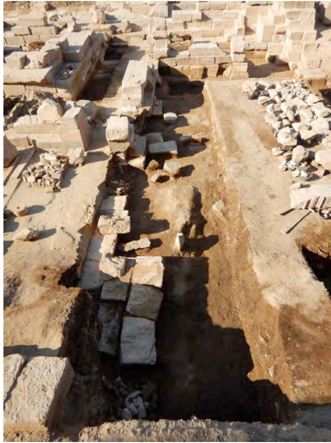
Fig. 2. Vue générale du sondage dans les espaces F1, F2 et F4.