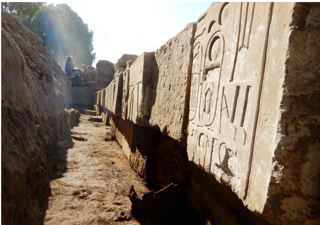
Fig. 12. Remplois thoutmosides sur la bordure est du « pronaos ».

Un bloc de grès possiblement ramesside a également été relevé au cours de cet inventaire. Émilie Saubestre a réalisé des ortho-images de cette documentation. Les tranchées ont été ensablées à l'issue de ce travail documentaire.