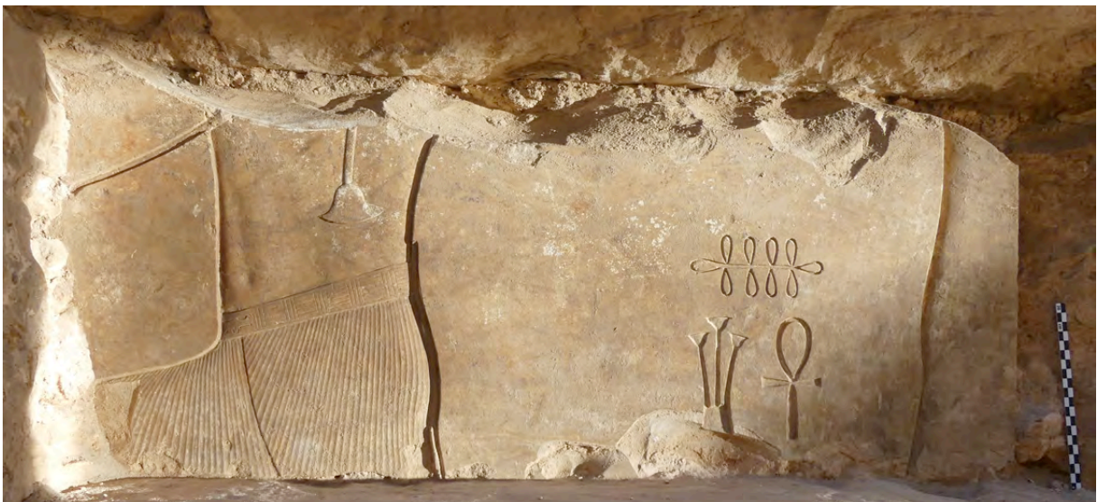
Fig. 10. Horus Behedety nouant une tige de papyrus ( sema-taouy ), Amememhat I er .

Enfin, il convient de mentionner deux fragments de stèles retrouvés dans les fondations du déambulatoire E (Fig. 11). Ils présentent des traits épigraphiques typiques de la XI e dynastie et complètent la série d'autres fragments de stèles privées de cette période découverts lors des campagnes précédentes.