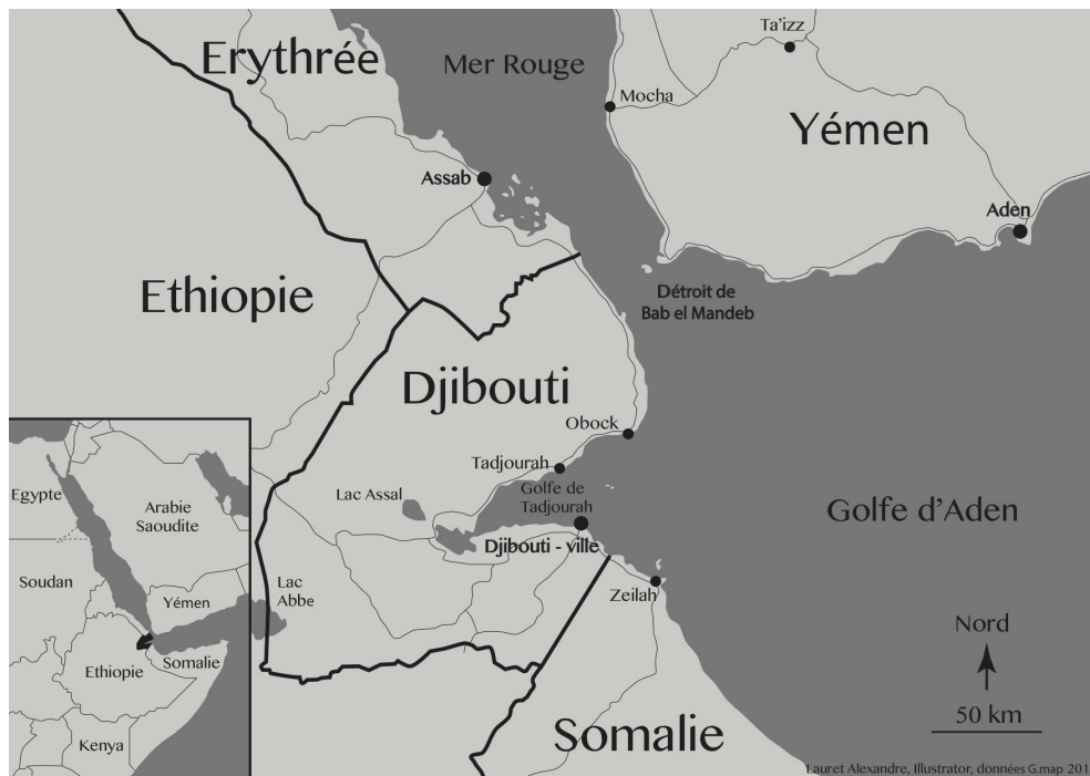
Carte 1 : Localisation de Djibouti et du sud du Yémen.