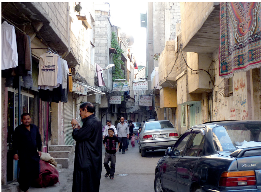
Figure 6. Quartier de Tichrine. Les quartiers informels sont généralement des espaces de mixité sociale et fonctionnelle.