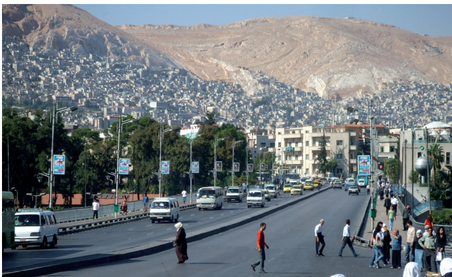
Figure 1. Les quartiers informels construits sur les pentes du mont Qassioun surplombent les quartiers huppés de la capitale.