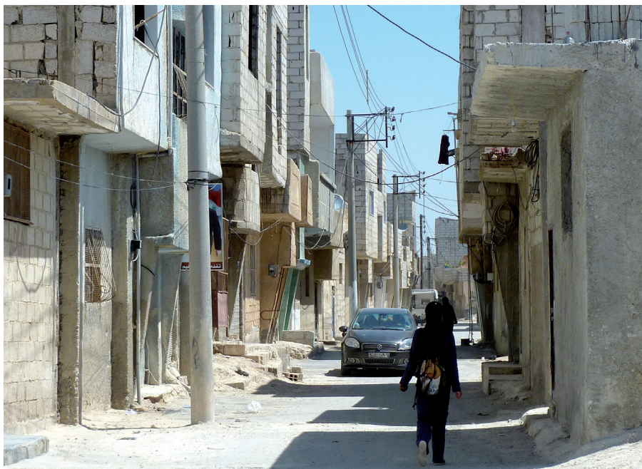
Figure 5. Quartier informel de Bahdalieh. Les quartiers informels damascènes sont le plus souvent équipés en services et infrastructures de base, excepté les quartiers les plus récents et les plus éloignés du centre. Ici, à Bahdalieh, équipé en eau et en électricité, les rues ne sont pas ou peu asphaltées, l'eau est polluée, l'assainissement est insuffisant et les écoles et les transports manquent.