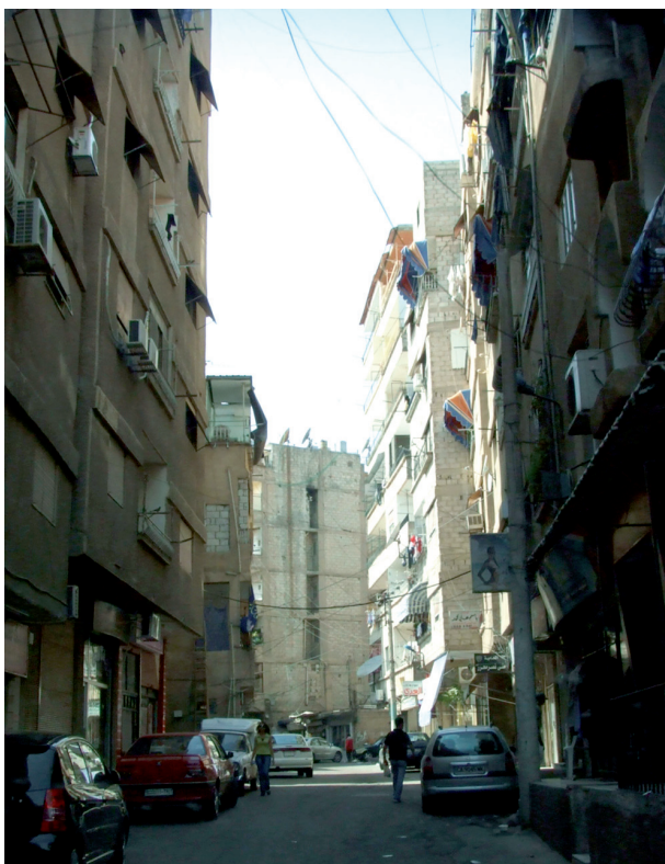
Figure 4. Quelques quartiers informels présentent des immeubles de quatre à six étages, comme ici à Mezzeh 86. [Cliché : V. Clerc, 2008.]