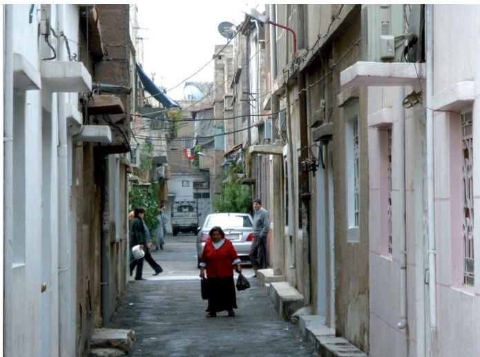
Figure 3. La plupart des quartiers informels présentent de petits immeubles contigus le long de rues étroites, comme ici à Tabbaleh.