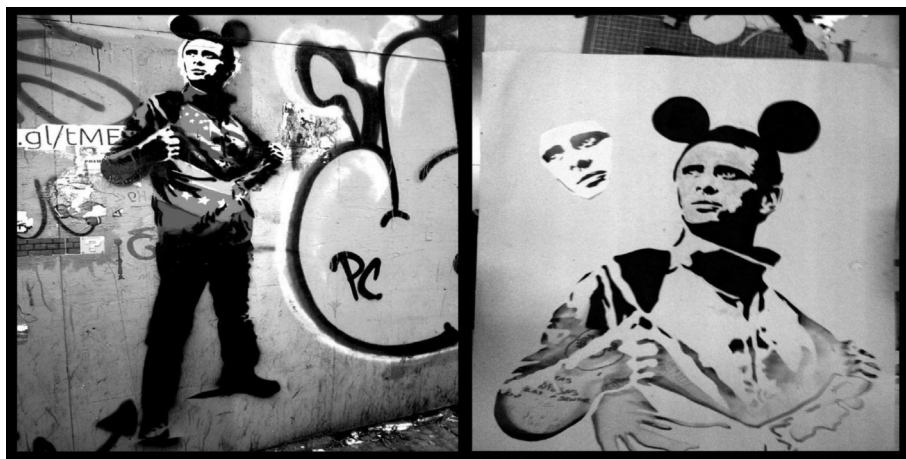
Document 5 - H. Capriles, principal candidat d'opposition à Chávez (CC, pochoir, 2012)

« Demain [2 semaines après la victoire du 7 octobre 2012], on a une journée de pochoirs, graffs et peintures collectives. Je ferai Angela Davis, je suppose que tu la connais, la militante afro-américaine... J'ai fait mes premiers travaux en campagne. Du coup là je me lâche un peu... 50 »