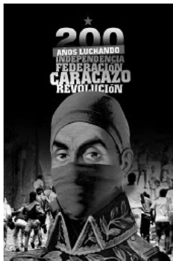
Document 1 - Simon Bolivar encagoulé (Alexis Vive, 2008)

quartier – bien que majoritairement « rouge » – que la kalachnikov mise dans les bras de la Vierge ou du Christ par des groupes voisins également issus de la guérilla 33 , la cagoule du Libertador symbolise la continuité entre la lutte estudiantine et proto-guerrillera des années 1980, le néo-zapatisme chiapanèque, et l'actuelle « révolution dans la révolution ». Sur fond d'images du Caracazo (1989), elle rappelle aux « boli-bourgeois » qu'ils doivent « commander en obéissant 34 ». L'« avant-garde » conditionne son projet communautaire « intégralement autogéré », Comuna el Panal 2021 35 , à la garantie de son « droit » à « tenir le quartier ». À l'inverse, non armés, les Guerreros de la Vega appellent à une « réconciliation nationale » abhorrée par les premiers – et voulue surtout à droite. Ils « [relayent] le message chrétien du gouvernement » via des fresques donnant « plus de chaleur » au slogan « vis la vie sans drogue » de l'Office National Anti-drogues 36 .