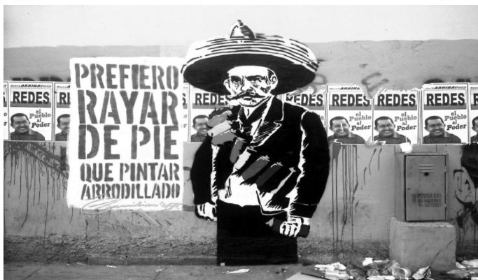
Document 3 - Slogan du Comando Creativo (pochoir, 2010)

« Au lieu de continuer à vouloir changer le monde dans mon coin, je suis sortie le faire en collectif... N'importe qui peut participer même s'il n'a jamais pris un pinceau... Beaucoup des ateliers qu'on donne, c'est à des gens qui veulent faire ça dans leur quartier, c'est pas des gens qui ont fait des études supérieures ou quoi... Y'a un mec qu'est mécano. Des jeunots. Des vieux aussi ».