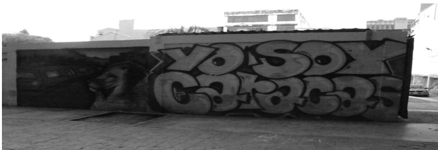
Document 8 - « Je suis Caracas » (graff, CMS, 2010)

La scène illustre bien la complexité des relations entre la pérennisation de l'ingénierie partisane chaviste et la persistance, voire l'augmentation, de différentes formes d'illégalisme populaire, irréductibles les unes aux autres. En fait de contestations, les élites chavistes doivent ici louvoyer entre les justifications post- guerilleras d'une violence politique incontrôlée et aux allures de guerre de gangs, et les éloges clandestins de « l'art pour l'art ». Usant des symboles des uns sans pour autant les désarmer, elles ménagent avec l'indifférence politique des autres. Bénéficiaire du « sens de la transformabilité politique du monde » 62 véhiculé par ces subversions larvées, ce « gouvernement des mouvements sociaux » 63 est aussi largement tributaire de l'informalité (statutaire, policière) qui les régit, les artistes les plus « marginaux » pouvant jouer ici et là – non sans ironie – les faire-valoir « populaires » du chavisme dans la rue. Ses représentants sont ainsi pris dans un jeu complexe entre le recrutement d'intellectuels et d'artistes sommés de s'engager au nom de leur statut, et la tolérance d'une critique subalterne croissante, jusqu'ici circonscrite à des expressions a-partisanes.