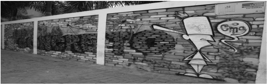
Document 7 - « Concret » / « béton » (graff, CMS, 2010)

Ceux-là font valoir leur droit au non engagement à l'écran. Devant un mur chaviste de la UCV, ils posent leurs « blases » sur une publicité surplombant l'autoroute d'une dizaine de mètres 58 , avant d'ajouter une phrase associant fétichismes marchand et idéologique: « mangez mes restes » 59 . Ailleurs, ils complètent le slogan de Pepsi-Cola : « partagez... les rêves » 60 . Aussi leur « collaboration » avec le chavisme est-elle l'occasion d'instiller dans les espaces concernés un « discours caché » 61 sur la politisation de leur art. Entre autres, deux murs leur ont été « offerts » dans le cadre du Bicentenaire de l'Indépendance, entre l'Assemblée nationale et la Place Bolivar. « Intégrés » à une esthétique chaviste , leurs murs se distinguent par l'absence de symboles politiques, conférant une portée critique aux scènes dessinées. Sur l'un, le graff « Concreto », aux lettres en forme de pavés, évoque un engagement « concret » et/ou « béton » ; et réclamant aux passants d'être dissocié de celui d'artistes visiblement « révolutionnaires », souvent soupçonnés d'être « achetés » (cf. document 7). Sur l'autre, en associant leur ville à ses symboles les moins connotés idéologiquement, le métro et le lion, le graff « Yo soy Caracas » (« Je suis Caracas ») revendique un graffiti omniprésent et qui ne peut, par essence, être régulé (cf. document 8).