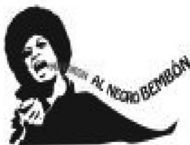
Document 6 - Angela Davis chante Ismael Rivera (CC, pochoir, 2012)