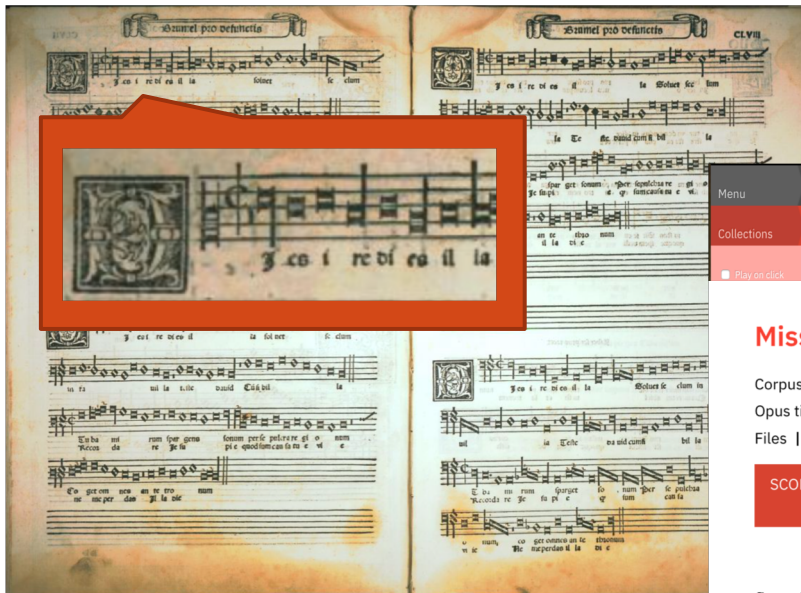
Brumel, Missa pro defunctis, Dies irae Liber quindecim missarum, Rome, Antico, 1516.

Brumel, Missa pro defunctis, Dies irae Bibliothèque de partitions NEUMA.