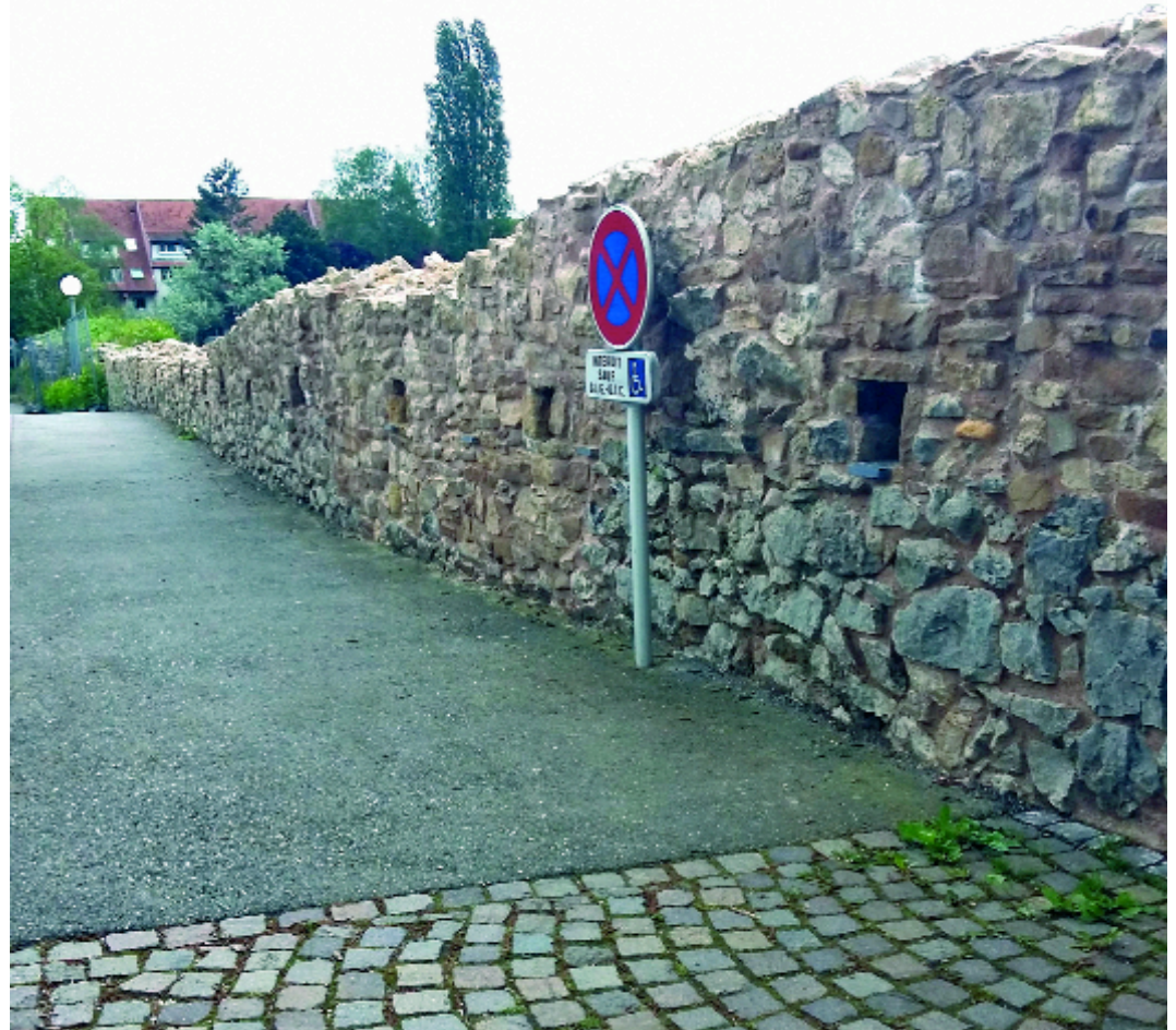
Fig. 6 – Rempart après restauration.