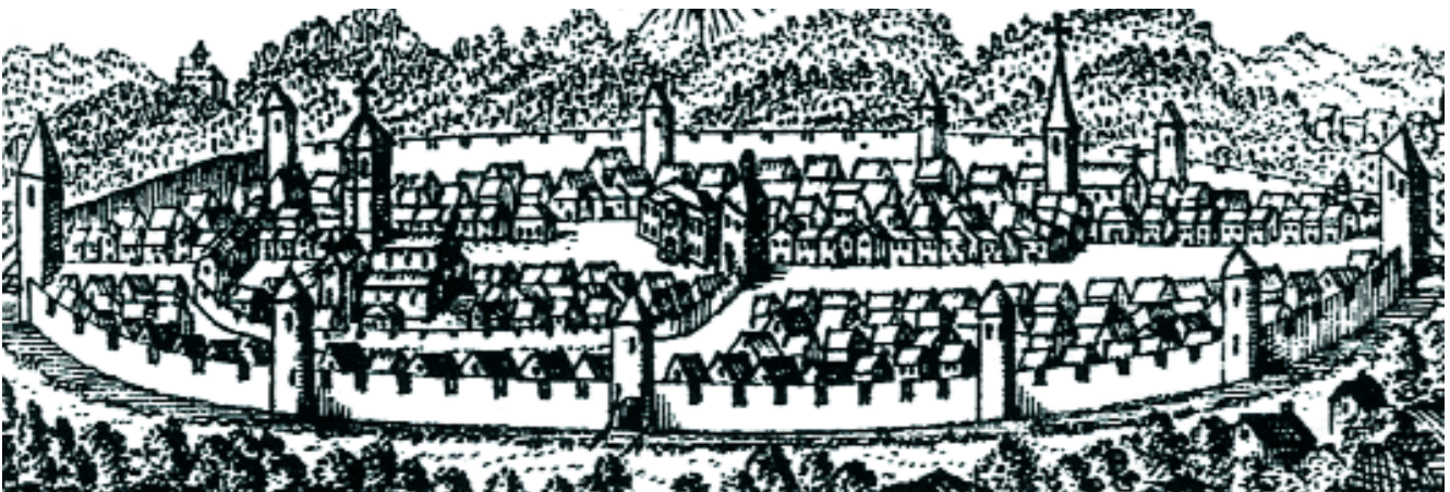
Fig. 2 – Vue de Rosheim tirée du livre de piété de la confrérie du Sacré-Cœur de Rosheim, 1769. Coll. part.