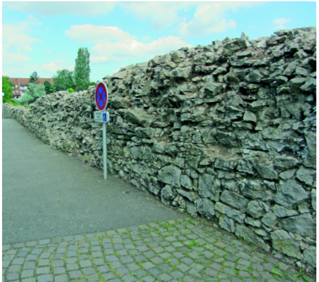
Fig. 5 – Enceinte avant restauration.