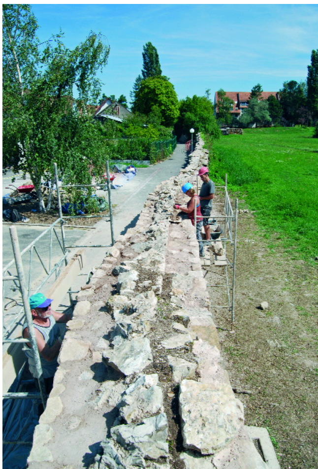
Fig. 3 – Vue de l'arase du mur et des deux états de fortification.