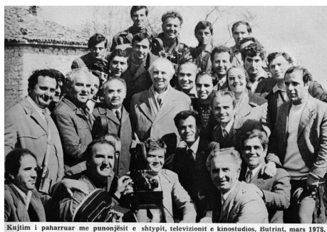
Fig.6. Ylli , prill 1985, (f.)29

Është gjithashtu domethënëse se vdekja e Enver Hoxhës në prill të vitit 1985 rezultoi në botimin e fotografive të quajtura “suvenire”, të tilla si ato të botuara dhe komentuar në revistën Ylli në maj të atij viti (fig.6): çifti Hoxha shfaqet në mes të fotografëve dhe gazetarëve të qeshur dhe fotografia është titulluar: “kujtim i paharrueshëm”. Vdekja e liderit kështu ngjall në sferën publike të njëjtin lloj reagimi siç ngjall në sferën private vdekja e një njeriu të dashur: fotografitë e të ndjerit i kërkojmë dhe i shohim, në një përpjekje për të mos e humbur atë plotësisht. Ne e dimë se një eksperiment i tillë është në fillimin e njërin prej librave më të njohur lidhur me studimet e fotografisë, Camera Lucida e Roland Barthes, i shkruar pas vdekjes së nënës së autorit (Barthes 1980).