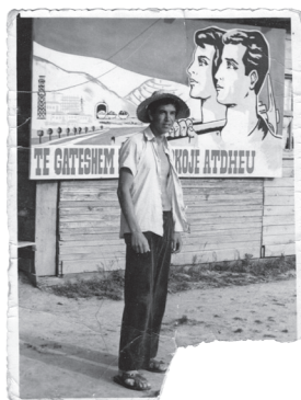
Fig.10. Berat, 1977

Kam synuar këtu të shfaq interesin e një shqyrtimi më të madh të fotografisë në reflektimin e kujtesës së periudhës komuniste në Shqipëri dhe për të treguar disa drejtime të hulumtimit. Puna që mbetet për t'u bërë në këtë fushë është e pafund: është njëkohësisht edhe një punë e mbledhjes, e dokumentimit dhe ruajtjes së fondeve fotografike, publike ose private, dhe një punë analize teknike, ikonografike, historike dhe antropologjike. Kjo është aq më shumë e nevojshme, pasi këto fonde janë në njëfarë mënyre ende të gjalla dhe gjithmonë “aktive”. Në Shqipërinë e sotme, pas rënies së komunizmit, këto fotografi janë të përfshira në proceset e trashëgimisë, si dhe në konfliktet e kujtesës. Këto fotografi janë gjithashtu të përfshira në atë që Harald Wydra e quan “demokratizimin e kujtesës” në shoqëritë postkomuniste (Wydra 2015: 202): këto imazhe janë gjithnjë të riinterpretueshme dhe mund të mbështesin histori të shumta dhe narracione kontradiktore. Ashtu si kujtesa, fotografia nuk është e fiksuar njëherë e përgjithmonë, por është vazhdimisht e ndërtuar në të tashmen.