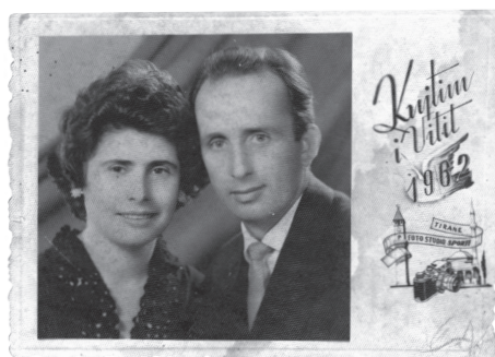
Fig.1. Tiranë, 1962