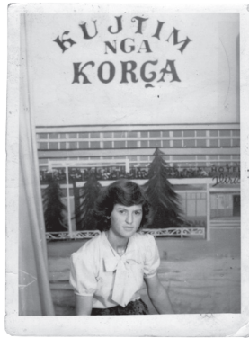
Fig.2. Devoll, rreth vitit 1980