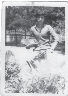
Fig.4. Shpat, 1990 (koleksion privat)