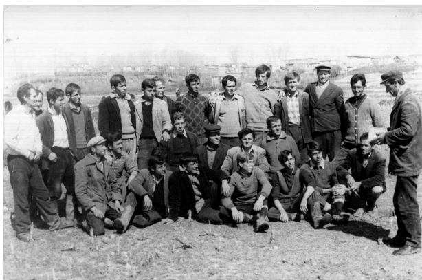
Fig.8. Devoll, 1980 (koleksion privat)

tografi një shoku në qytetin fqinj, reagimi i tij i parë ishte vënia në dukje e një detaji që mbeti i pavënë re nga unë dhe të tjerët, por që e goditi atë: vetëm brigadieri mban këpucë, burrat e tjerë janë të veshur me çizme. Ai pa në të shenjën e pozicionit të privilegjuar të brigadierit, si dikush që nuk do të merrte pjesë në punën fizike me anëtarët e brigadës. Kjo është punctum-i siç e percepton Roland Barthes, diçka që na prek, na mbërthen në një fotografi, pavarësisht nga njohuria që mund të na sjellë.