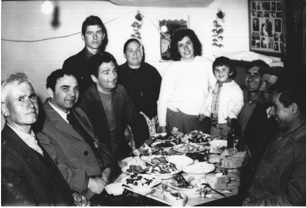
Fig.7. Devoll, 1980

tiviste dhe qëndruan brenda natës në familjet e fshatrave. Fotot e bëra në raste të tilla u shtypën në kopje të shumëfishta dhe iu dërguan pjesëmarrësve të ndryshëm.