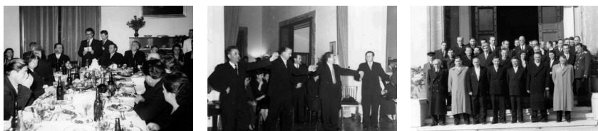
Fig.5. Tiranë, 1957

Nga ana tjetër, funksioni përkujtimor i fotografisë nuk kufizohet vetëm në sferën familjare, dhe një pjesë e madhe e fotografisë zyrtare ose institucionale (ajo që ishte planifikuar si “fotografi propagande”) është gjithashtu pjesë e dëshirës për të fiksuar dhe ruajtur kujtimet. Për këtë arsye, veprimtaria e anëtarëve të Komitetit Qendror të Partisë së Punës ishte çdo vit objekt i albumeve fotografike, marrëdhënia e të cilave me albumet e familjes mund të shfaqet lehtësisht, si në këto pamje të pritjes së një delegacioni bullgar në Tiranë më 1957 (fig. 5): fotografi grupi para shtëpisë, skenat e tavolinave me njerëz dhe kërcimeve janë ndër pamjet më të shpeshta të fotografisë familjare.