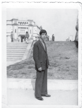
Fig.9. Tiranë, 1976