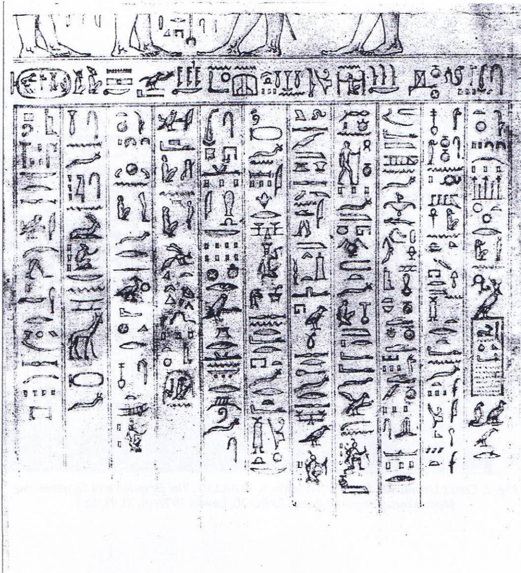
Fig. 3. Recueil É. Dupérac, inv. 26.403. Cabinet des dessins, musée du Louvre (© RMN).