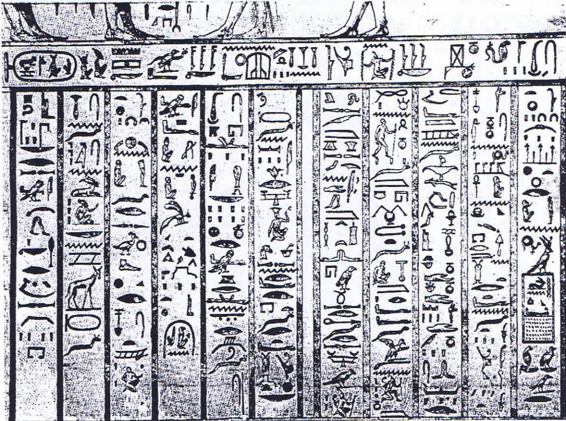
Fig. 2. Codex Ursinianus , fol. 6, r°. (D'après A. ROULLET, The Egyptian and Egyptianizing Monuments of Imperial Rome , EPRO 20, Leyde, 1972, pl. XLVI, 62 ).