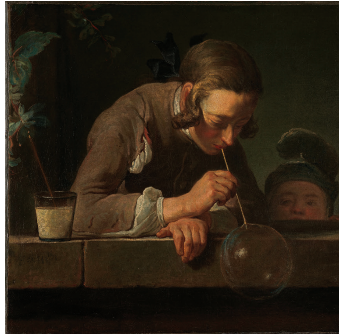
« Tout est magie, ou rien, ni blanche ni noire, ne se montre que ce qui est capable de se cacher d'abord, d'une mobilité magnétique l'image vibre et le monde avec, on n'est jamais sûr de voir ce petit solide suspendu, un signal si discret et naturel prêt à disparaître avant de revenir encore pour les beaux yeux du jeune homme et ceux de son voisin tombé de la lune », Suzanne Doppelt, 2018, Rien à cette magie , Paris, P.O.L