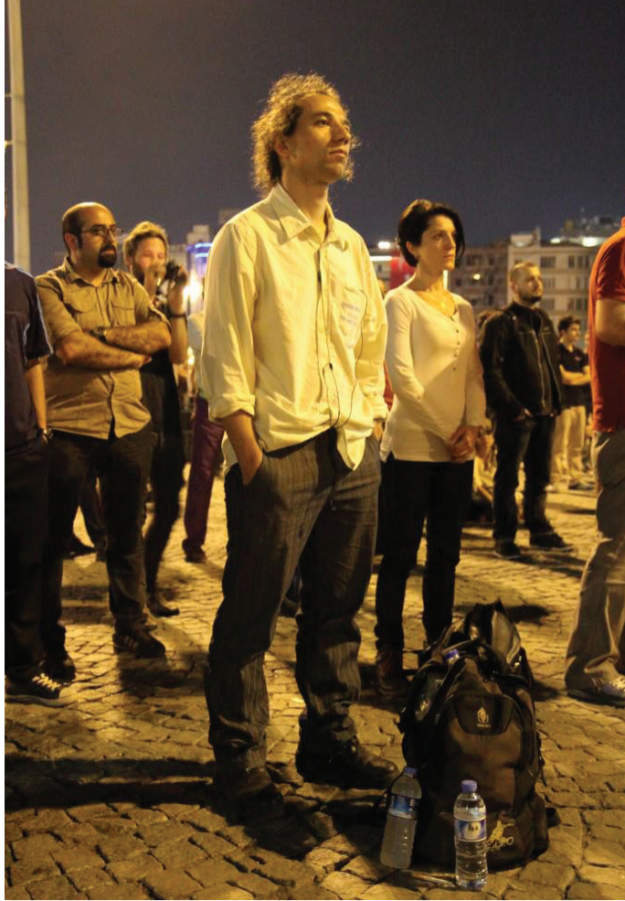
"Duran adam", l'homme debout. En se tenant droit, immobile et silencieux lors des contestations de la place Taksim (Istanbul), le chorégraphe Erdem Gündüz a rallié à lui de nombreux concitoyens, rassemblés dans une opposition sans message, ni programme, attirés d'autant plus l'attention qu'ils échappaient à toute assignation.