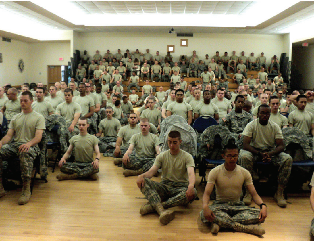
Photographie de presse, Chiang Rai Times, 2016 https://www.chiangraitimes.com/could-invincible-defense-technology-work-for-thailand.html

technologies censées fabriquer ou pré-orienter notre attention dans le domaine marchand et, de plus en plus, dans toutes les sphères de nos vies (politiques, relationnelles...). Même le statut de (télé-)spectateur passif, débordant de « temps de cerveau disponible », naguère si prisé et objet de toutes les convoitises, n'est plus satisfaisant pour les formes les plus avancées du capitalisme. Il n'offre pas assez d'occasions pour recueillir et générer des informations marchandisables et monétarisables 1 . La passivité n'est un idéal que dans un monde qui n'a plus cours. Chaque individu est désormais tenu de s'activer en vertu de ses goûts, de ses émotions, de ses opinions, etc. Chacun devient l'agent de sa propre mise en marché. Le capitalisme travaille au conditionnement et à l'exploitation de notre attention, il n'est pas un domaine qui ne déploie pas sa petite expertise: « management de l'attention », « marketing de l'attention », « design attentionnel » 2 .