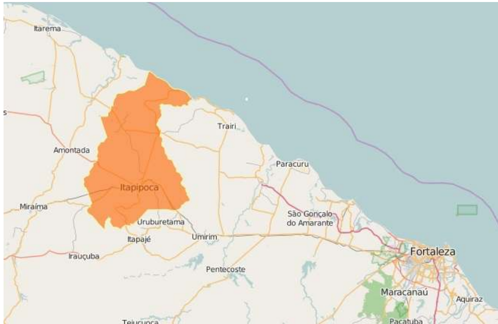
Figure 1 : Municipalité d'Itapipoca, Ceará