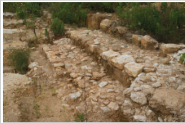
Les fondations des gradins de l'hippodrome romain de Beyrouth. © J. Aliquot, CNRS/HiSoMA 2009

Les jeux du cirque figurent en bonne place aux côtés de l'École de droit parmi les titres de gloire de Beyrouth qu'énumère l' Expositio totius mundi et gentium , catalogue topographique latin du IV e siècle après J.-C. Dans la Vie de Sévère d'Antioche, les étudiants des années 480 s'enflamment pour les courses de chars. Selon Zacharie le Scholastique, l'auteur du récit hagiographique, le futur patriarche aurait démasqué des condisciples qui projetaient de sacrifier de nuit un esclave éthiopien dans l'hippodrome de la ville. La réputation maléfique du cirque tient autant aux rixes des factions qu'à ces pratiques magiques. En 1929, une tablette d'exécration relative à l'envoûtement d'une écurie a été trouvée près du lieu où Robert Du Mesnil du Buisson, pionnier de l'archéologie beyrouthine, reconnaissait la trace d'un champ de courses extra-muros à l'ouest de la ville antique. Depuis, les fouilles du quartier de Wadi Abu Jamil ont mis au jour les gradins, les stalles de départ ( carceres ) et la construction centrale ( spina ) d'un hippodrome d'environ 330 m de long sur 60 m de large, associé à un théâtre et à des bains. Elles laissent entrevoir la possibilité d'une fondation précoce du cirque par les rois hérodiens, bienfaiteurs de Beyrouth.