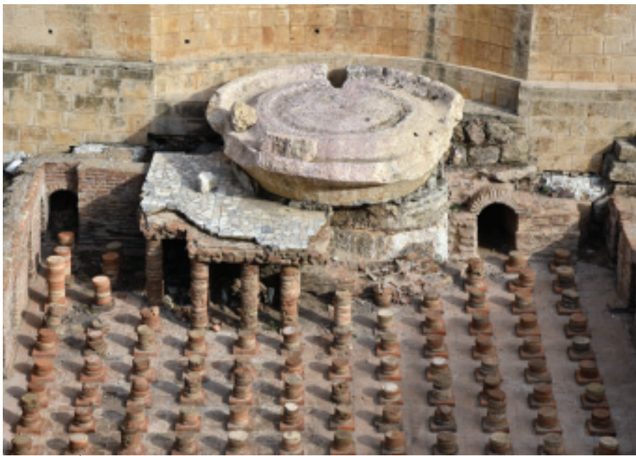
Les thermes impériaux mis au jour sur le versant oriental de la colline du Sérail à Beyrouth.