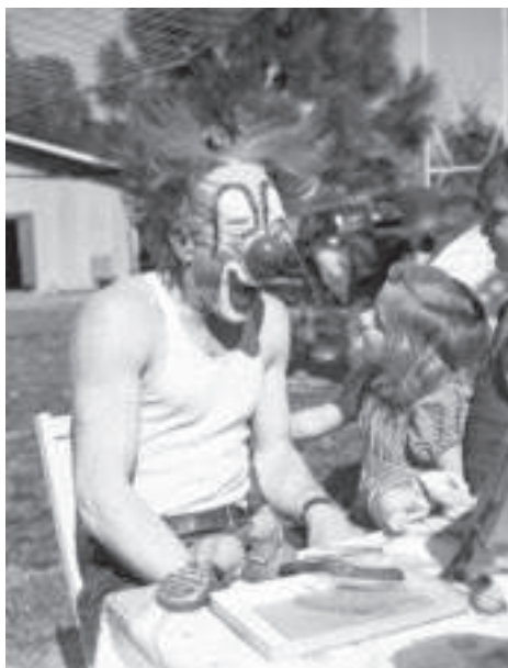
Lou Jacobs, le clown du Ringling Circus avec Carla Wallenda, Sarasota, Florida, 1941

Le jeu du clown repose sur un rapport permanent avec un public qu'il s'agit d'apprivoiser.