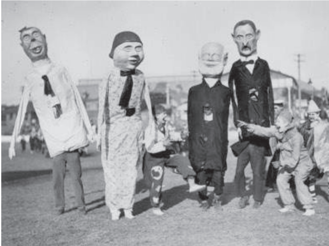
Clowns avec des gens portant de grandes figures de carnaval en papier-mâché, c. 1930

de stage » 13 : ne surtout pas faire le clown ! S'il peut être tentant de chercher à exercer un pouvoir sur autrui à travers la capacité à faire rire, ce pouvoir ne peut s'exercer alors que dans un registre confiné, celui du rôle socialement attendu du clown de faire rire sur commande, qui étrangement ne correspond pas à la pratique effective du clown. L'efficacité, si elle existe, en tant que technique du corps, réside non pas dans la capacité à faire rire, mais plutôt dans la capacité de l'acteur à montrer ses propres limites. Le « mauvais clown » est celui qui n'intègre pas ce savoir faire, parce qu'il manque d'authenticité – il n'a pas de vécu intérieur et plaque un cliché de clown –, ou parce qu'il est un « faux » clown opportuniste – il porte un nez de façon stéréotypique mais sans exigence d'un travail –, ou qu'il est « raté » – vu comme un imposteur –, se contentant de raconter des blagues sans avoir de jeu de clown (Cézard 2014 : 157-164) 14 .