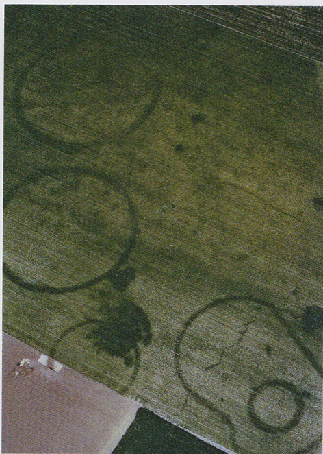
Vue aérienne de traces d'encls funéraires de l'Âge du Bronze, à Noyelles-sur-Mer (Somme).

L'archéologie traditionnelle met au point, elle aussi, dès les années 1950, de nouveaux outils d'analyse. François Bordes propose le premier l'établissement d'indices et de listes types, suivi en 1966 par Georges Laplace (inventeur de la « typologie analytique ») et par A. Leroi-Gourhan (celui de la « morphologie descriptive »). Ces méthodes visent essentiellement à rationaliser la typologie des outils en pierre taillée en normalisant les critères de description et en ayant largement recours à la statistique.