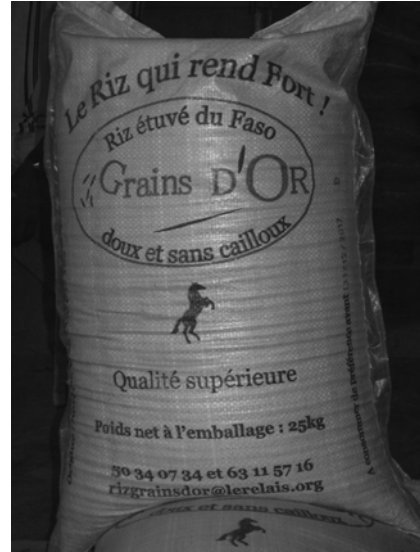
Figures 2 et 3. Deux sacs de « riz national » vendus à Ouagadougou en avril 2013 (à gauche) et en avril 2015 (à droite)

Ces tentatives de remodelage du goût constituent un enjeu de pouvoir entre ces commerçants et les grandes sociétés d'importation, dès lors que la promotion du riz national va parfois de pair avec une dévalorisation du riz importé. Ainsi que l'exprime un grossiste de Ouagadougou, « les gens disent qu'ils veulent un riz qui gonfle, mais l'expérience est donnée que le riz qui gonfle est d'un vieux stock de cinq, dix ans... alors que le riz burkinabé que nous commercialisons, lui, il est bon 47 ». Un autre, de Bobo-Dioulasso, précise :