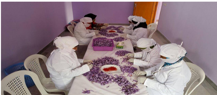
Photo 1 : les Femmes au siège de Coopérative Tamount Laaine n'Ait hemd pour la production et la commercialisation de Safran.

L'image associée au territoire de Taznakhte est liée au tissage des tapis traditionnels, certains écrits ont l'appelé « la capitale du tapis traditionnel au Maroc 7 », et cette logique d'association d'image du tapis au territoire de Taznakhte le ministère de l'artisanat et de l'économie sociale et solidaire en partenariat avec d'autres acteurs locaux et régionaux a organisé chaque année au centre de Taznakhte le Festival de tapis ouazguiti qui arrive en 2017 à sa 5eme édition. Cet événement important a permis une promotion de tapis et de la région en général dans les médias nationaux et internationaux.