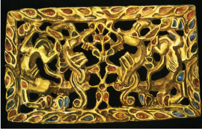
FIG. 10. – Collection Sibérienne, Saint-Pétersbourg. D'après JETTMAR, 1960, p. 200.