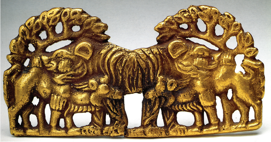
FIG. 3. – Collection Sibérienne, Saint-Pétersbourg. Photo V. Terebenine, d'après SCHILTZ, 1994, fig. 38. Avec l'aimable autorisation des auteurs.