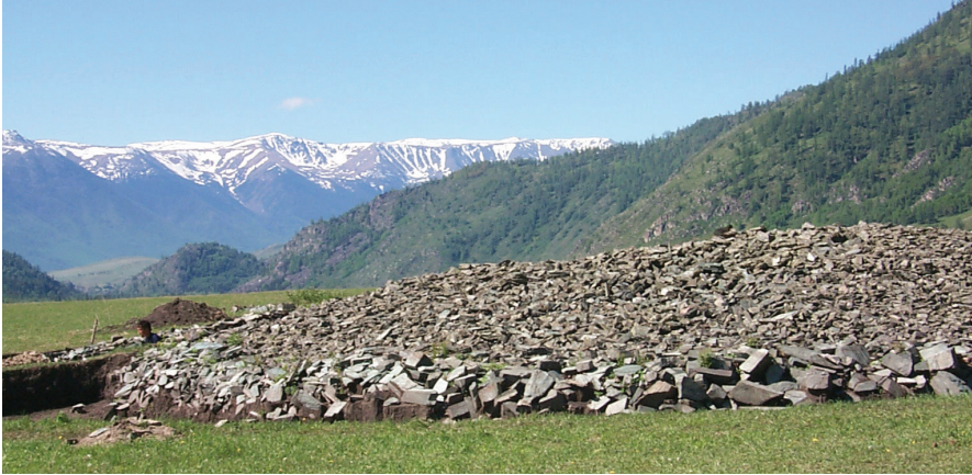
FIG. 1. – Tumulus de Berel', Altaï, Kazakhstan.

en 2000. Pâturages mais aussi forêts règnent dans cet environnement de montagnes, vers 1 200 m d'altitude 5 (fig. 1). Nous y trouvons une utilisation des arbres pour enfermer le corps momifié des défunts, comme dans la plupart des cultures de la zone steppique : pin de Sibérie pour les planches de la chambre funéraire et un gros tronc pour le sarcophage monoxyle, ainsi qu'écorce de bouleau pour envelopper comme d'un linceul végétal l'ensemble de la chambre et de la fosse latérale aux chevaux sacrifiés (fig. 2). La présence de l'arbre est massive et le travail de charpentier est parfaitement maîtrisé. Cependant, ce n'est pas tant de l'homme (mort) dans l'arbre dont nous allons traiter, que, plutôt, de l'arbre lui-même, tel qu'il est figuré sur l'homme, car presque toutes les images que nous examinons appartiennent à des ornements corporels. Ainsi, au IV e siècle av. J.-C. à Khunivka (steppe d'Europe) une plaque ajourée nous montre, dans une espèce de rinceau, un archer monté qui suit un cerf parmi des plantes et des arbres 6 . Cette association de l'arbre et du cerf se retrouve, avec encore des herbivores, des oiseaux