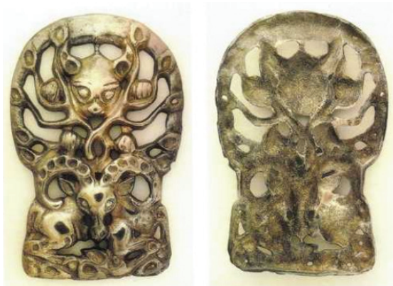
FIG. 11. – Derestuy, Bouriatie. D'après MINYAEV, 2007, frontispice. Avec l'aimable autorisation de l'auteur.

de face, présentées en pleine frontalité. On aperçoit nettement des branches feuillues qui paraissent vouloir montrer que le félin s'apprête à bondir depuis un arbre. La bordure à motifs amygdaloïdes aligne les feuilles et les sabots. Un objet analogue appartient à la collection Thaw du Metropolitan Museum de New York 30 .