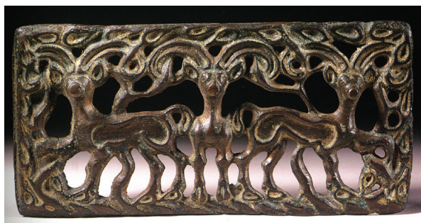
FIG. 7. – D'après PANG, 1998, n° 92.