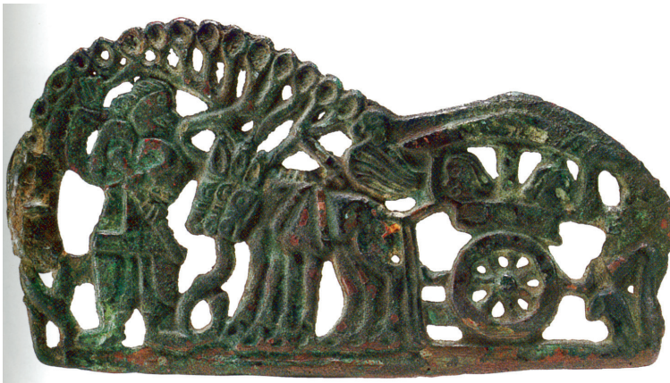
FIG. 13. – D'après BUNKER, 1997, n° 243.

collection sibérienne vue précédemment, où l'arbre dessine des formes qui surplombent et quasiment enveloppent les quelques sujets représentés, qu'ils soient animaliers ou humains.