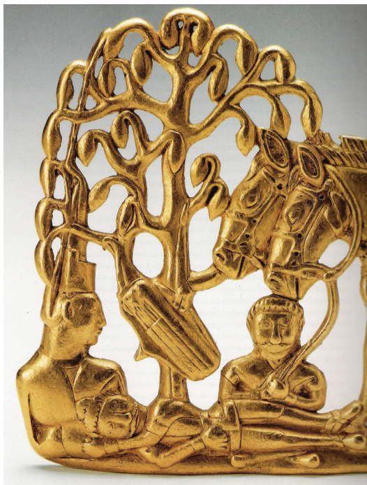
FIG. 5. – Collection Sibérienne, Saint-Pétersbourg. Photo V. Terebenine, d'après SCHILTZ, 1994, fig. p. 241. Avec l'aimable autorisation des auteurs.