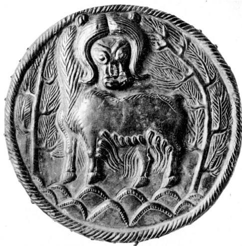
FIG. 6. – Noin-Ula, Mongolie. D'après TREVER, 1932, pl. 25.2.