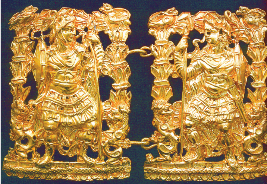
FIG. 16. – Tillya Tépa. Broche de la tombe no 3. D'après CAMBON éd., 2006a, n° 79.

Ainsi, les boucles de ceinture de Tillya Tépa 51 ou celles du monde parthe et kouchan 52 , en or avec leurs bordures ornementales en gouttes incrustées de turquoises, même si elles sont dérivées des rangs d'oves (pour les secondes) ou des cœurs emboîtés issus eux-mêmes des feuilles de lierre (pour les premières) 53 , s'écartent, elles aussi, franchement de la manière Xiongnu de représenter et d'orner les cadres : nous sommes là encore dans un autre monde artistique, celui de traditions de nomades dans l'Orient hellénisé.