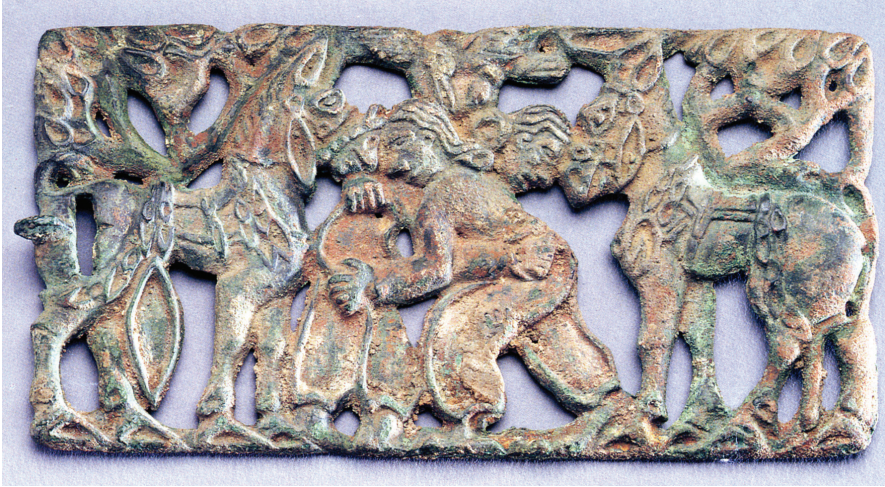
FIG. 12. – Collection Sackler. D'après So et BUNKER, 1995, pl. 1.