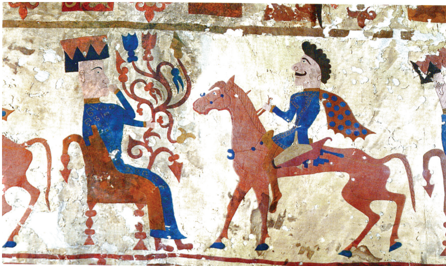
FIG. 18. – Pazyryk 5. Musée de l'Hermitage. Photo V. Térébénine, d'après SCHILTZ, 1994, fig. 209-210. Avec l'aimable autorisation des auteurs.

ils évoquent une forme d'arbre cosmique, de l'univers à trois étages 58 , ou encore peuvent signifier le domaine forestier, celui des âmes et de la chasse. Les arbres modèles réduits dressés sur les coiffes ou les motifs dendrifformes