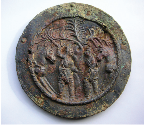
FIG. 17. – Phalère Saka.