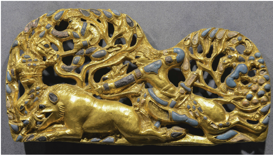
FIG. 4. – Collection Sibérienne, Saint-Pétersbourg. d'après SCHILTZ, 1994, fig. 38b.

d'une manière pseudo-naturaliste la fameuse chasse du peuple des Iyrques décrite par Hérodote (IV. 22) 12 (fig. 4). On y reconnaît en effet un archer à cheval lancé au galop volant derrière un sanglier, à droite, une montagne sur laquelle grimpe un ibex et se dresse un arbre et, au-dessus du sanglier qui