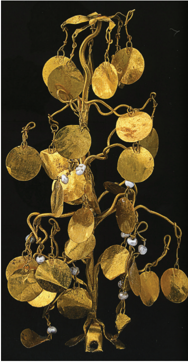
FIG. 14. – Tillya Tépa. Aigrette de coiffe de la tombe n° 4. D'après CAMBON éd., 2006a, n° 211.