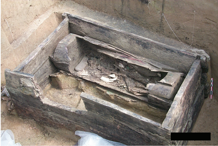
FIG. 2. – Chambre funéraire de Berel'.

et des arbres, à Ust-Labinskaja (Krasnodar) 7 et, toujours en Europe pour le moment, à Novotcherkassk (Khokhtlatch) sur un célèbre diadème 8 . Quant aux grands cerfs de Filippovka (en bois doré à la feuille qui mesurent environ 50 cm), dans l'Oural, ce sont leurs bois qui évoquent des arbres, comme on le sait, y compris par leur caducité et leur régénération saisonnière 9 .