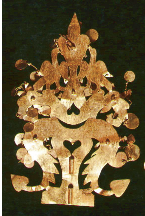
FIG. 15. – Tillya Tépa. Couronne de la tombe n° 6. D'après CAMBON éd., 2006a, n° 134.

étages, du bas en haut : 1) une tête de dragon-poisson pour le monde aquatique souterrain, 2) des colonnes et des poissons à queue végétalisée (comme un chapiteau corinthien) pour la terre, et 3) des oiseaux perchés pour le monde aérien 40 . Une autre tombe féminine (n° 3) a donné de belles broches en or représentant la version pré-kouchane d'un guerrier macédonien, qui aujourd'hui nous intéresse moins que le cadre, encore une fois à trois étages : 1) un dragon au bas, 2) un niveau de colonnes végétales avec des palmettes étagées et terminées comme des acanthes et 3) en haut, des oiseaux (fig. 16). Les personnages sont réalisés dans une manière hellénisante, mais ils sont placés à l'intérieur d'un univers à trois étages, celui des peuples originaires de la steppe 41 . Nous avons développé naguère ce point important de l'expression de notions steppiques dans la Bactriane 42 .