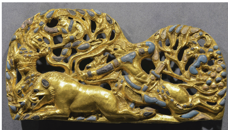
FIG. 4. – Collection Sibérienne, Saint-Pétersbourg. Photo V. Terebenine, d'après SCHILTZ, 1994, fig. 38b. Avec l'aimable autorisation des auteurs.

d'une manière pseudo-naturaliste la fameuse chasse du peuple des Iyrques décrite par Hérodote (IV. 22) 12 (fig. 4). On y reconnaît en effet un archer à cheval lancé au galop volant derrière un sanglier, à droite, une montagne sur laquelle grimpe un ibex et se dresse un arbre et, au-dessus du sanglier qui