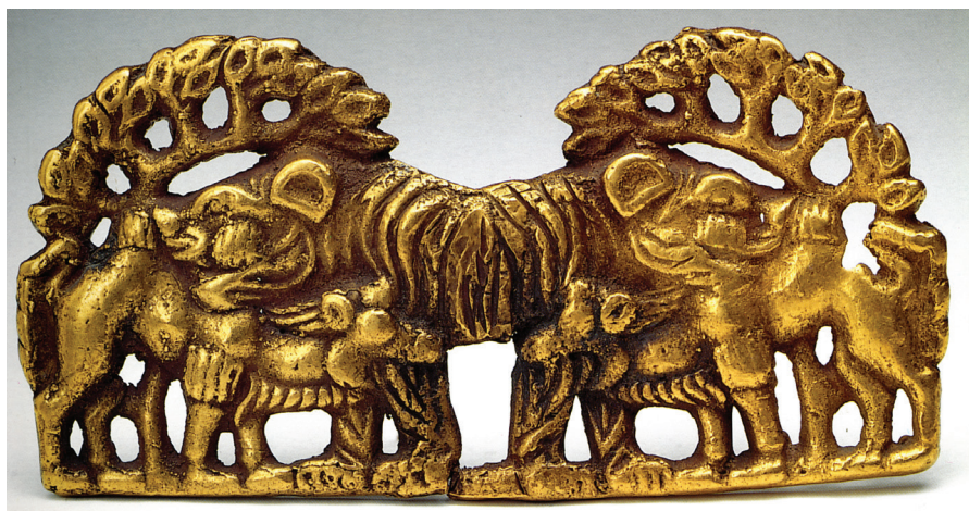
FIG. 3. – Collection Sibérienne, Saint-Pétersbourg. Photo V. Terebenine, d'après SCHILTZ, 1994, fig. 38. Avec l'aimable autorisation des auteurs.