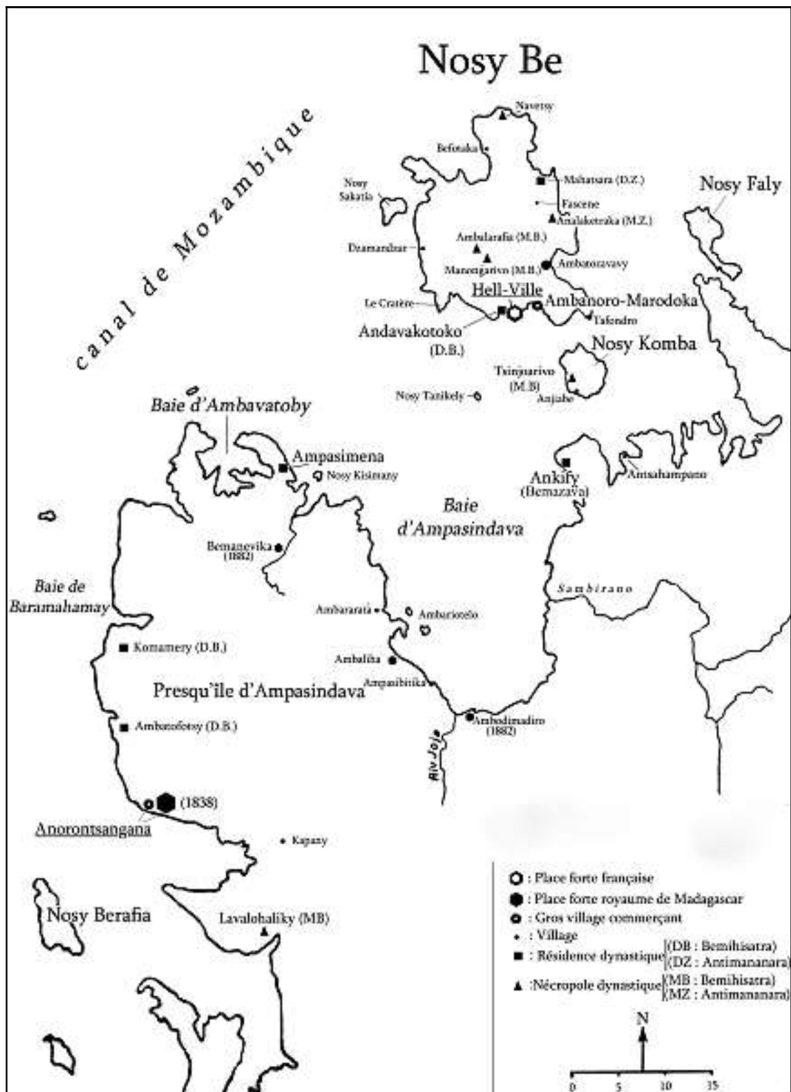
Carte 15. La baie d'Ampasindava au XIX e siècle