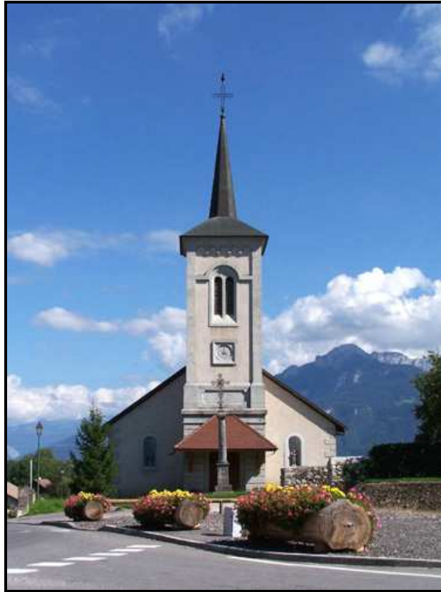
Fig. 3 : L'église de Cornier, devant laquelle a lieu la mise en possession du mandement du Châtelet-de-Crédoz en 1700

Cette description sommaire du contenu des documents nous montrent bien tout leur intérêt et je voudrais à présent me focaliser sur quelques aspects, en citant des exemples précis.