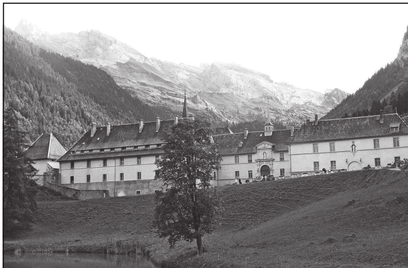
Fig. n° 5 : La chartreuse du Reposoir en Haute-Savoie en 2014

pastorales qu'elle favorise et des relations nourries, allant bien au-delà du simple rapport patron-client, entre les moines et les paysans bornandins ? L'essor démographique attesté pour cette période 9 a-t-il favorisé ces rapports ? Le bon contexte économique général a-t-il induit le développement d'une certaine « aristocratie » au sein des agriculteurs du Grand-Bornand et de Saint-Jean-de-Sixt, élite dont faisait assurément partie la famille de Pierre Favre et dont les membres ont pu s'orienter volontiers et plus facilement vers l'état ecclésiastique 10 ? Ces pistes, probables, restent à creuser, en l'absence d'études plus précises sur la question.