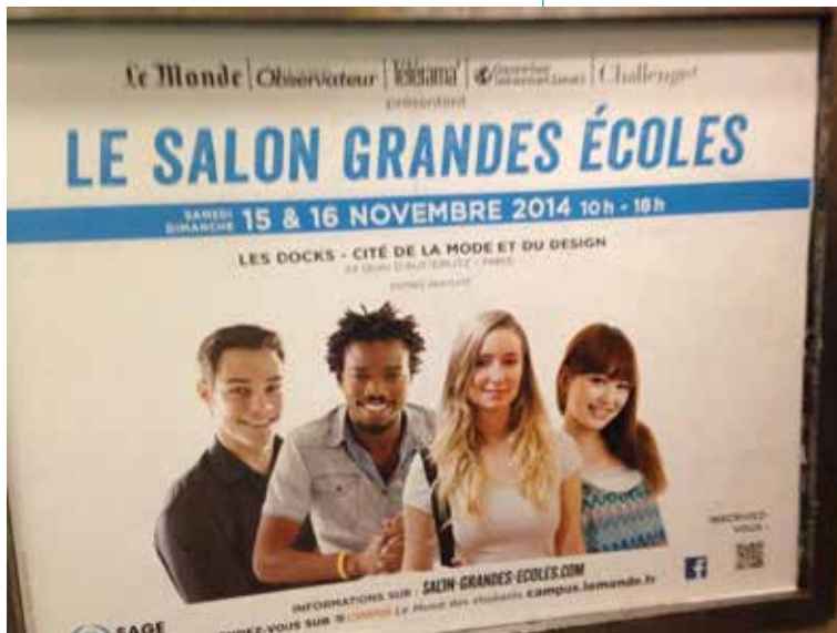
Illustration 1. Affiche de la campagne pour « Le Salon Grandes Écoles » 2014

Affiche de la campagne pour le « Salon Grandes Écoles » à la Cité de la Mode et du Design des 15 et 16 novembre 2014 à Paris.