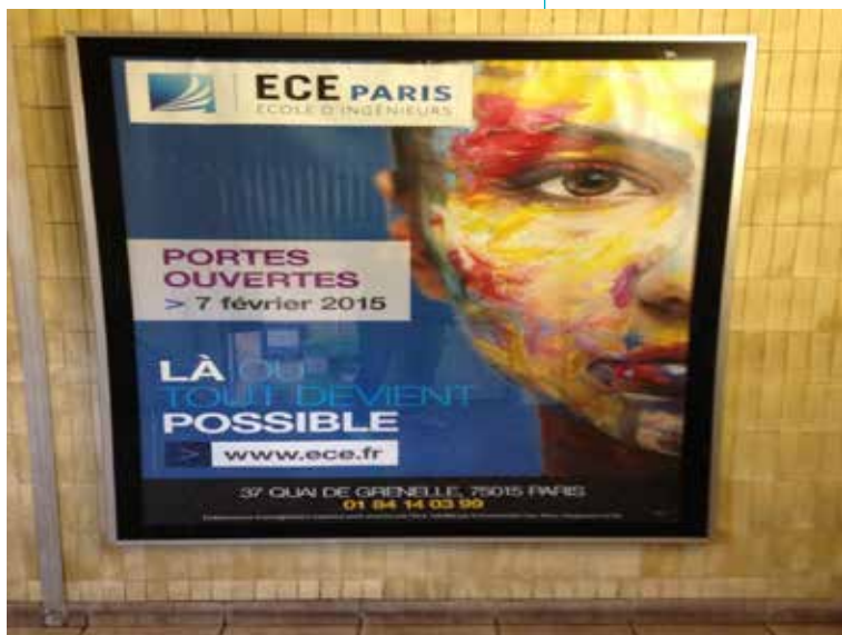
Illustration 3. Affiche de la campagne pour les portes ouvertes 2015 de l'ECE Paris

Affiche de la campagne de communication pour les portes ouvertes du 7 février 2015 de l'ECE Paris, école d'ingénieurs.