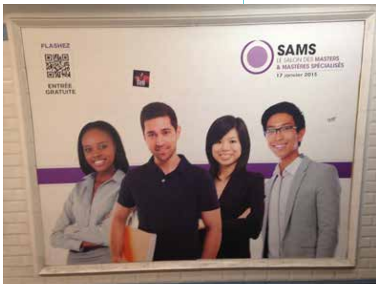
Illustration 2bis. Affiches de la campagne pour le Salon des Master & Mastères spécialisés 2015 – Visuel 2

Affiche de la campagne pour le Salon des Master & Mastères spécialisés du 17 janvier 2015 à Paris. Visuel 2.