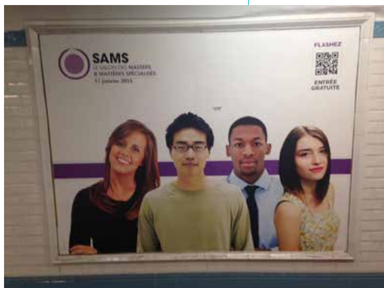
Illustration 2. Affiches de la campagne pour le Salon des Masters et Mastères spécialisés 2015 – Visuel 1

Affiche de la campagne pour le Salon des Master & Mastères spécialisés du 17 janvier 2015 à Paris. Visuel 1.