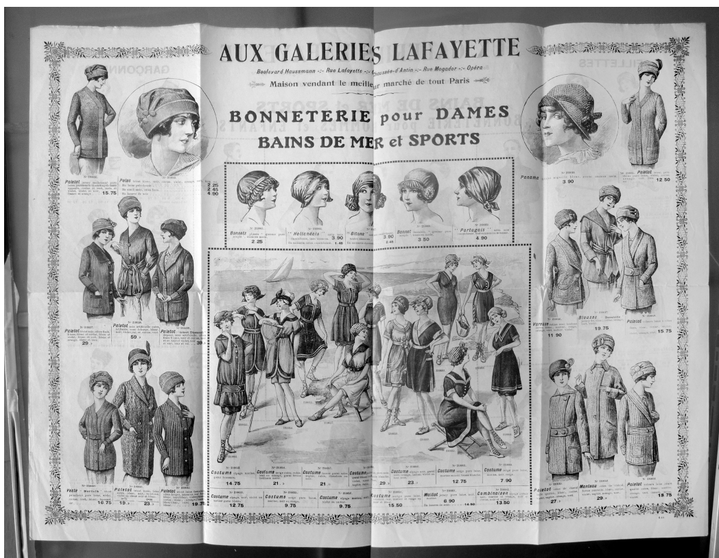
Page du Catalogue des Galeries Lafayette, « Bonneterie pour dames. Bain de mer et sports », 1911.