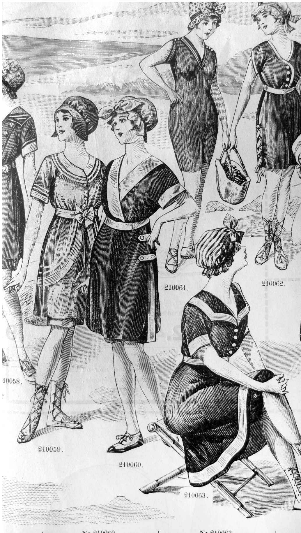
Détail, page du Catalogue des Galeries Lafayette, « Bonneterie pour dames. Bain de mer et sports », 1911.