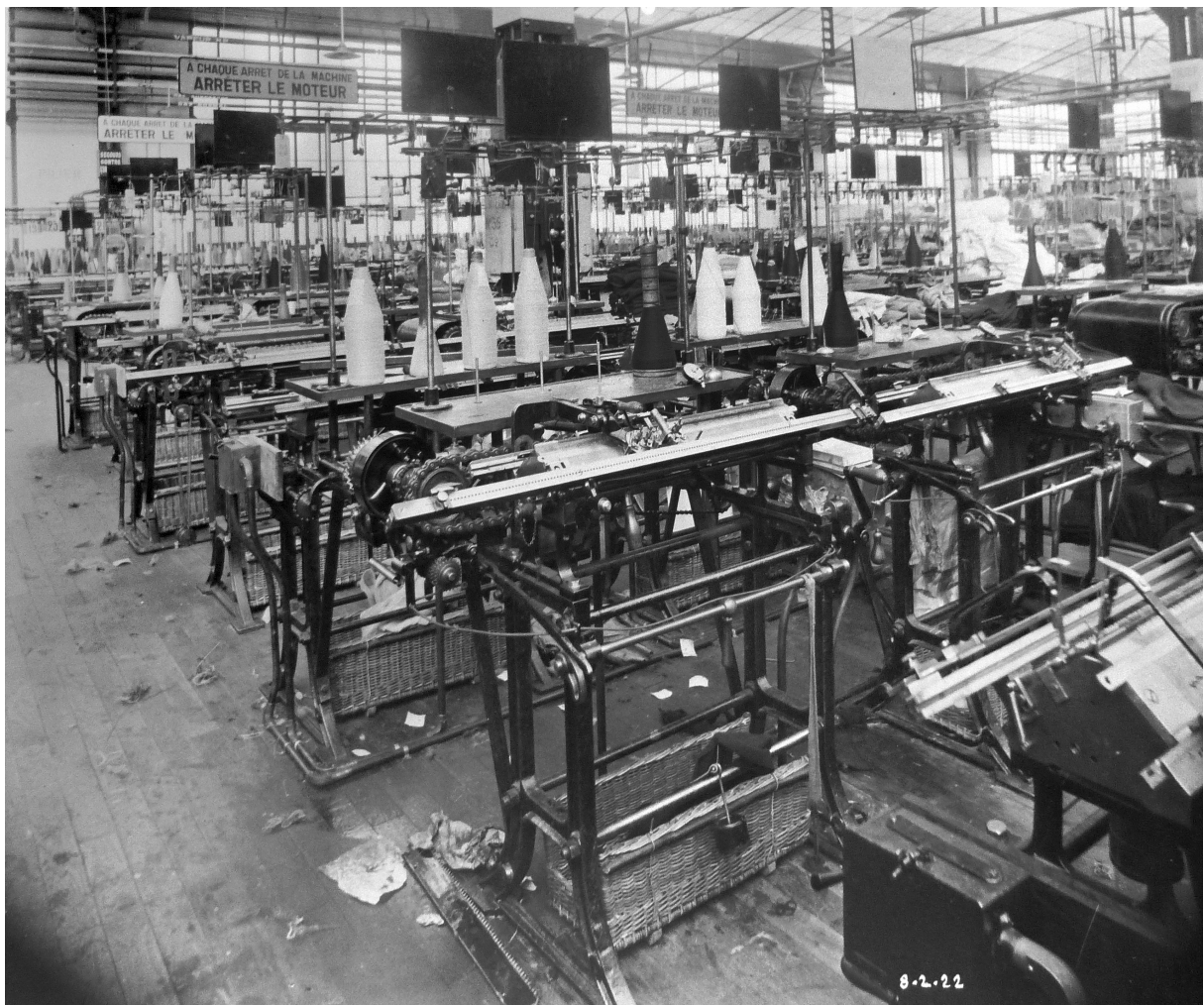
Atelier de machines à tricoter dans les ateliers de la Société parisienne de confection, rue de Crimée, installations de 1920-1921, photographie de 1922.