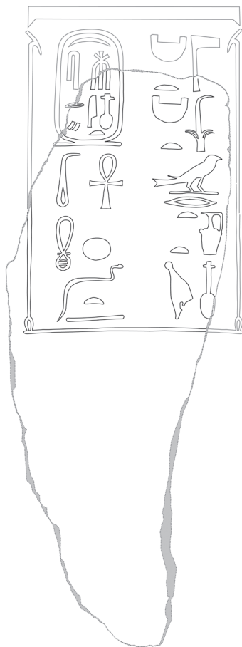
Fig. 3. Fac-similé de l'inscription et restitution de l'état original supposé (© L. Gabolde).

p. 43-46 ; L. Troy, Patterns of Queenship in Ancient Egyptian Myth and History (Boreas 14), 1986, p. 118 ; L. Gabolde, Monuments décorés en bas-reliefs, aux noms de Thoutmosis II et Hatchepsout à Karnak (MIFAO 123), 2005, p. 40, n. c.