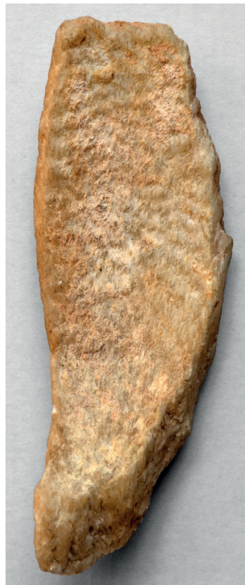
Fig. 2. Fragment de vase de la collection J.-G. Kauffmann (auteur de la photo). V°.