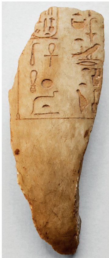
Fig. 1. Fragment de vase de la collection J.-G. Kauffmann. R°.

funéraire votif classique. L'état de conservation n'aide cependant pas à déterminer son profil primitif. La courbure légèrement plus accentuée vers le bas fait néanmoins penser à une forme arybalistique 9 .