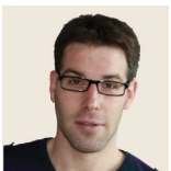
AUTEUR Boris Helleu TITRE Maître de conférences Université de Caen Basse-Normandie (EA 4260)

T ous les organisateurs de compétition de sport collectif s'interrogent sur la formule la plus adaptée à leur tournoi.