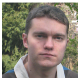
AUTEUR Nicolas Scelles TITRE Maître de conférences Université de Poitiers (EA 1722)

Dans un article précédent, nous avons développé le concept d'intensité compétitive en l'appliquant à la Coupe du monde de la FIFA 1 . L'article qui suit soulève la même question, mais cette fois pour les compétitions sans phase finale. Objectif : étudier l'intensité compétitive intra-championnat. Le terrain retenu est celui de la Ligue 1 française de football sur la période 1932-2011.