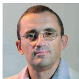
AUTEUR Christophe Durand TITRE Professeur des universités Université de Caen Basse-Normandie (EA 4260)